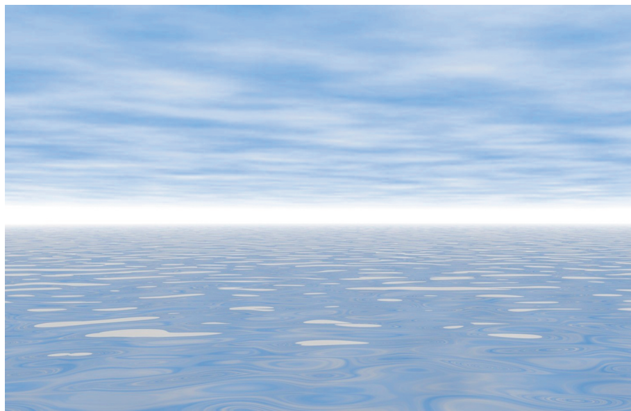
Fig. 3.21 (a e b)