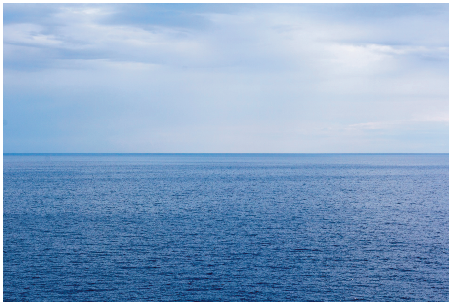
Fig. 3.20 – Foto di Max Krauß da Pixabay.