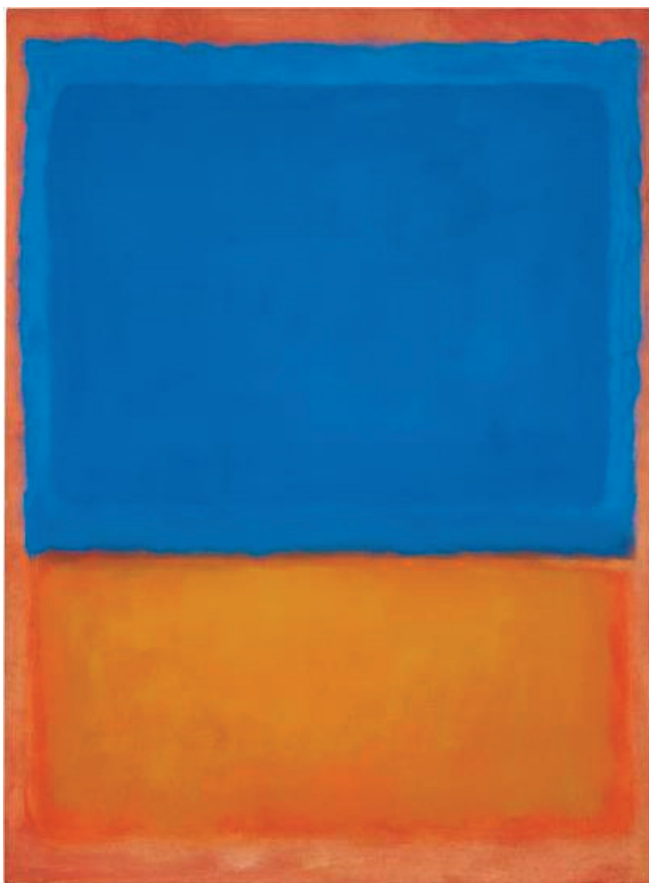
Fig. 3.19 – Mark Rothko, Senza titolo (Rosso, blu, arancione) , 1955, Collezione privata.