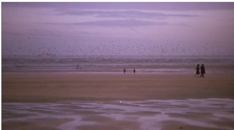
Un uomo, una donna, 1966, Claude Lelouch.