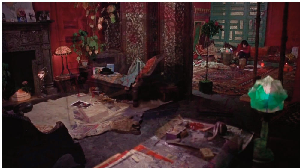
Sadismo, 1970, Nicolas Roeg.