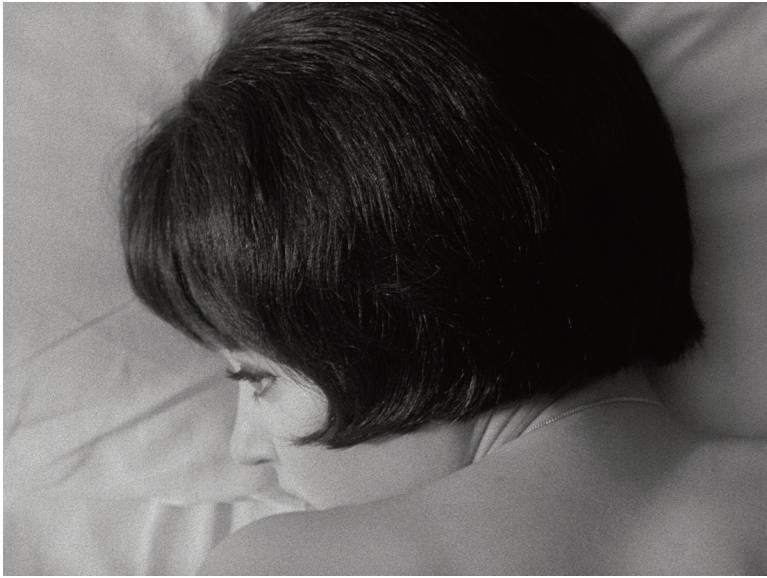
Questa è la mia vita , 1962, Jean-Luc Godard.