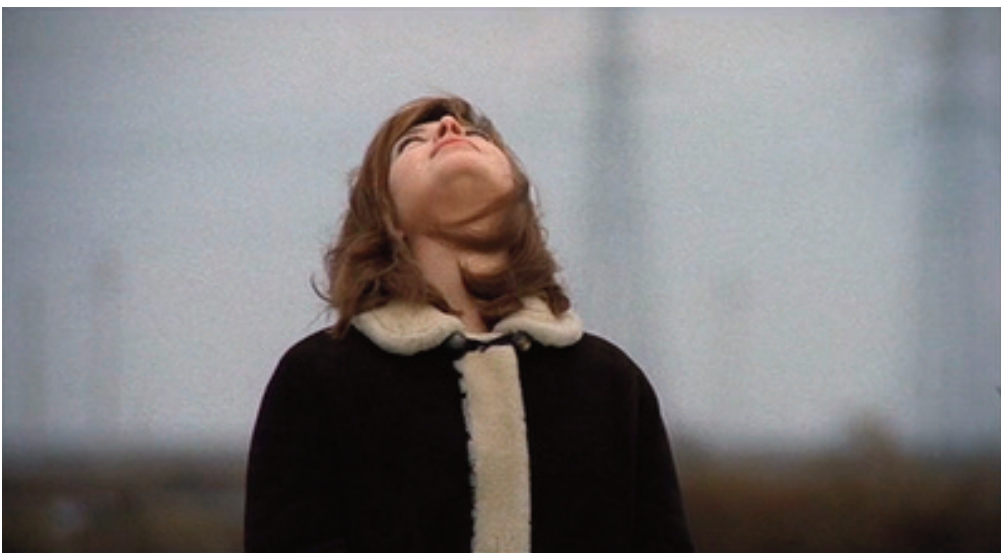
Il deserto rosso , 1964, Michelangelo Antonioni.