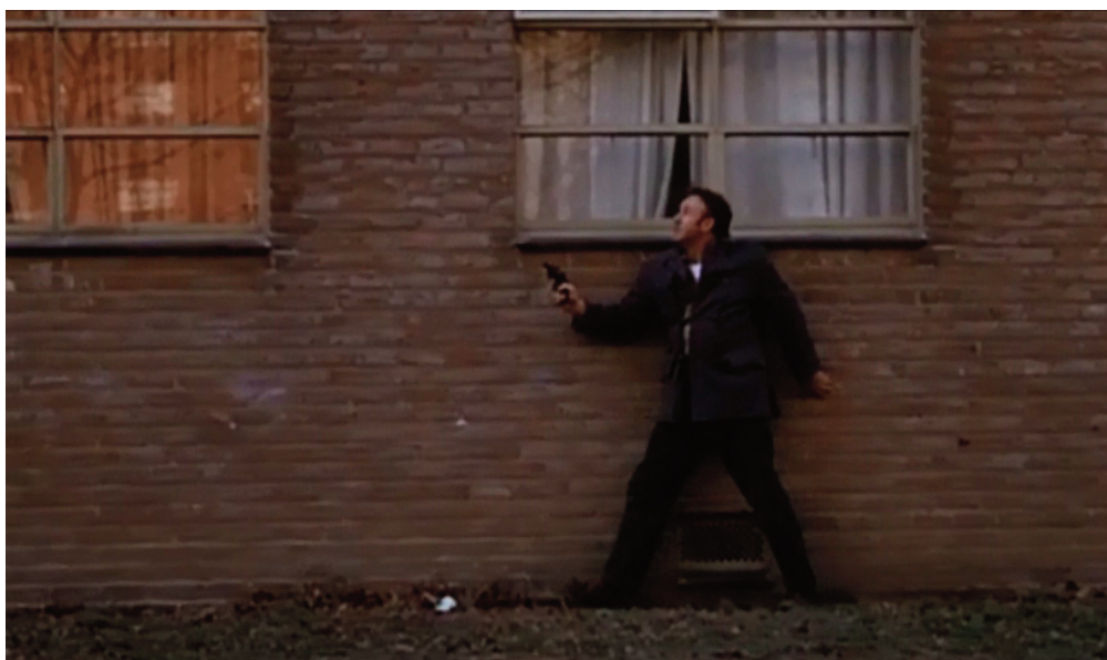
Il braccio violento della legge , 1971, William Friedkin.