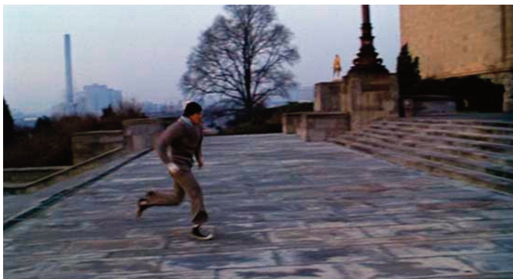
Rocky , 1976, John G. Avildsen.