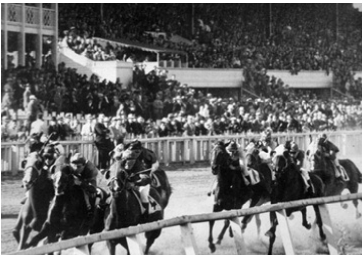
Rapina a mano armata, 1956, Stanley Kubrick.