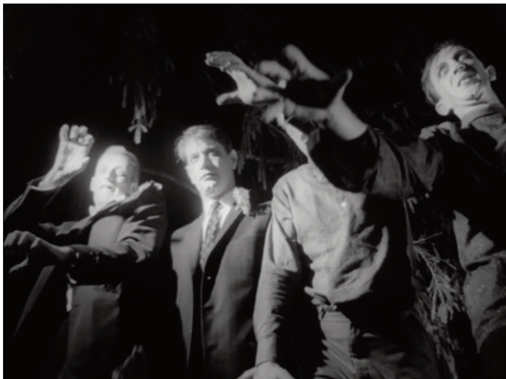
La notte dei morti viventi, 1968, George A. Romero.