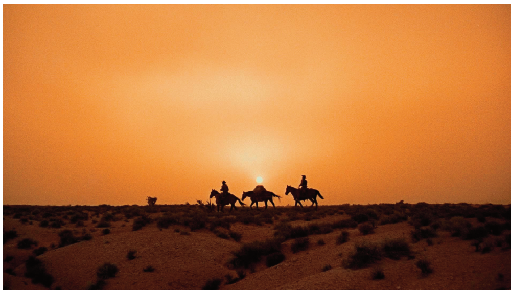
Vista Vision in Sentieri Selvaggi , 1956, John Ford.