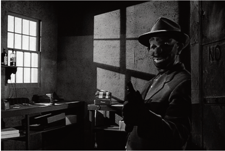
Rapina a mano armata, 1956, Stanley Kubrick.