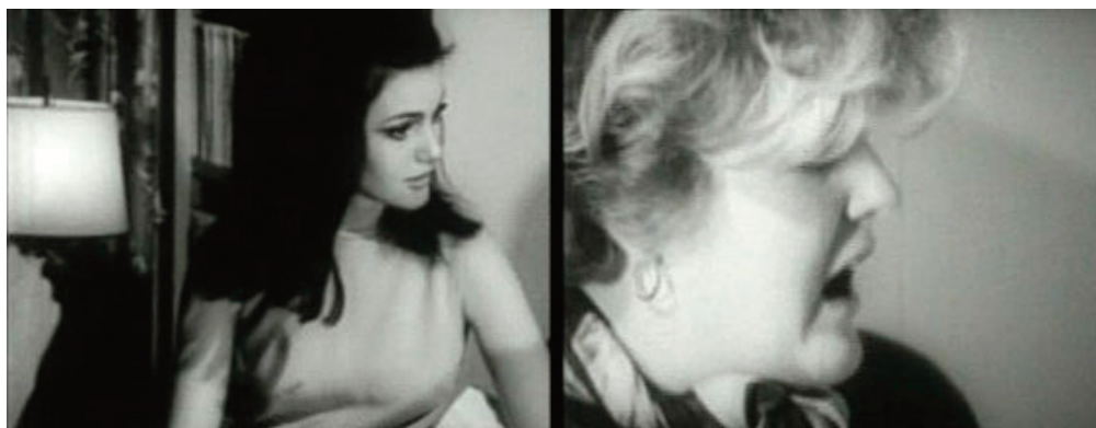
The Chelsea Girls , 1966, Andy Warhol e Paul Morrissey.