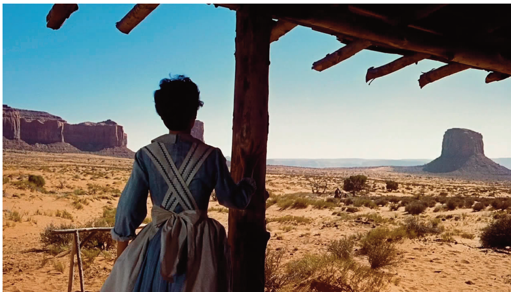
Il Vista Vision in Sentieri Selvaggi , 1956, John Ford.