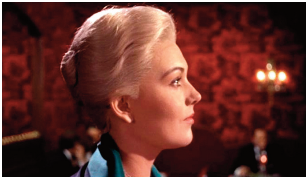
Vista Vision e contrasto tra verde e rosso nella Donna che visse due volte , 1958, Alfred Hitchcock.