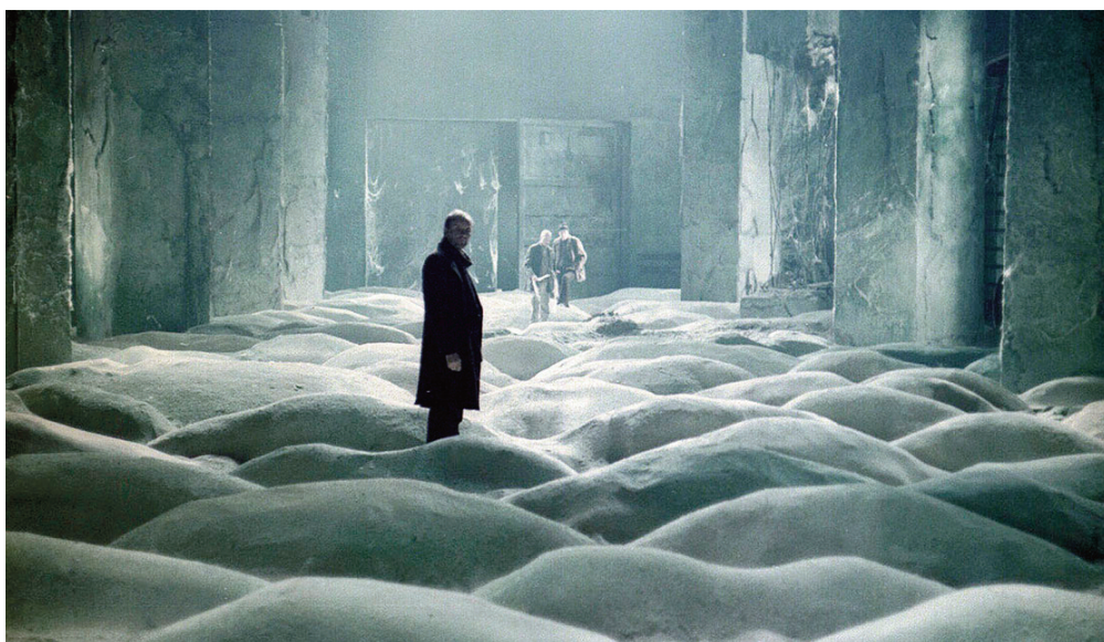
Stalker , 1979, Andrej Tarkovskij.