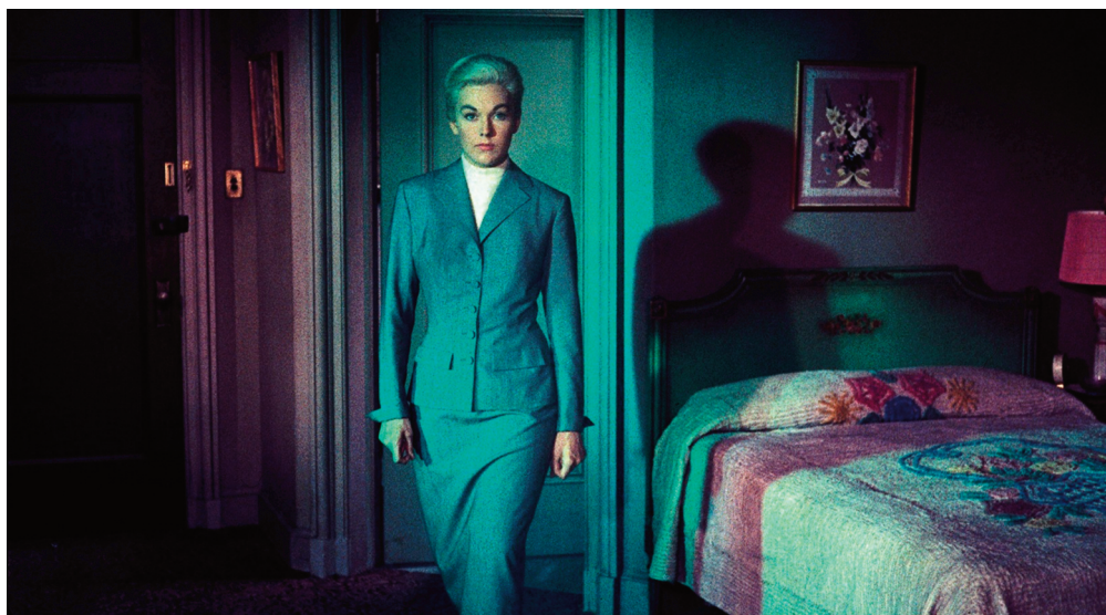
Vista Vision e contrasto tra verde e rosso nella Donna che visse due volte , 1958, Alfred Hitchcock.