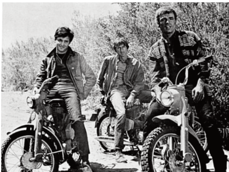
Motorpsycho! , 1965, Russ Meyer.