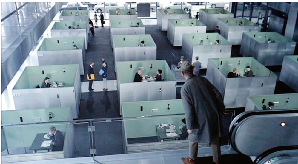
Playtime , 1967, Jacques Tati.