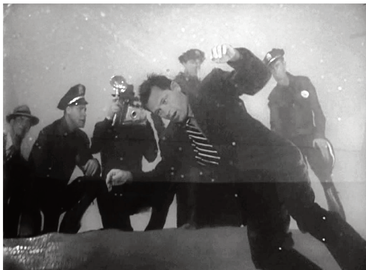
Viale del tramonto, 1950, Billy Wilder.