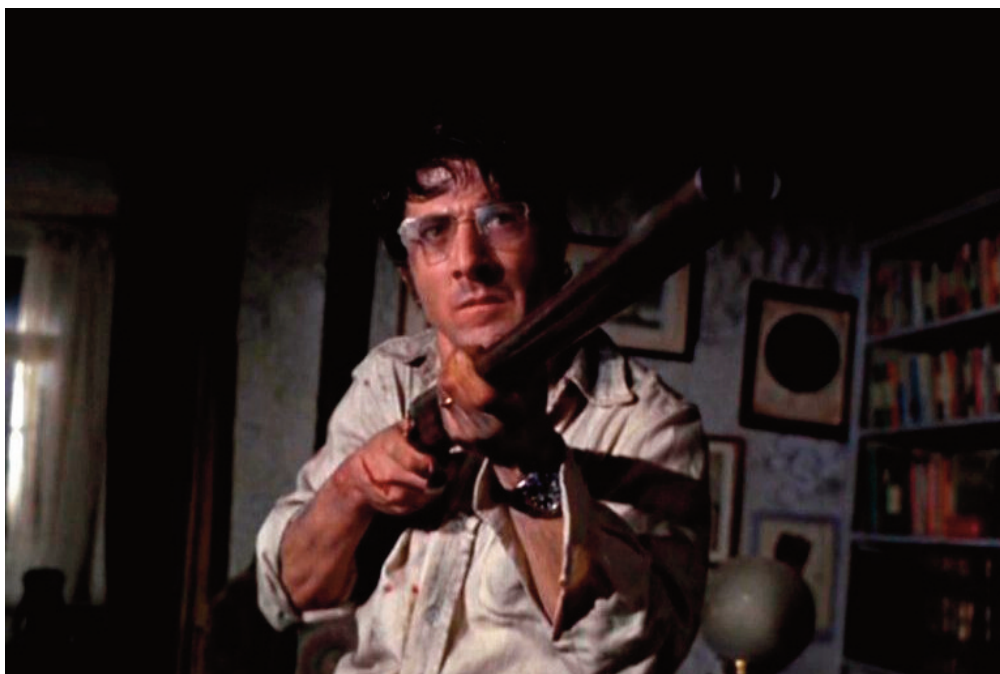
Cane di paglia , 1971, Sam Peckinpah.