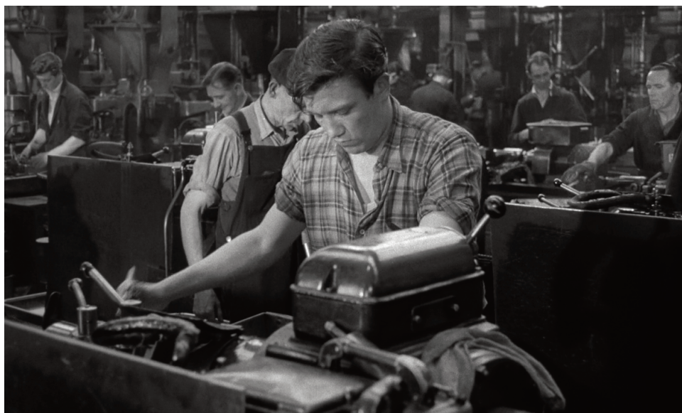
Sabato sera, domenica mattina . 1960, Karel Reisz.