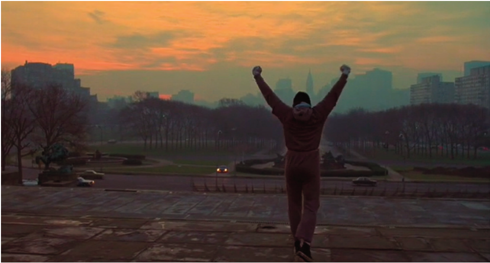
Rocky , John G. Avildsen.