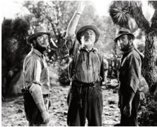
Il tesoro della Sierra Madre, 1948, John Huston.