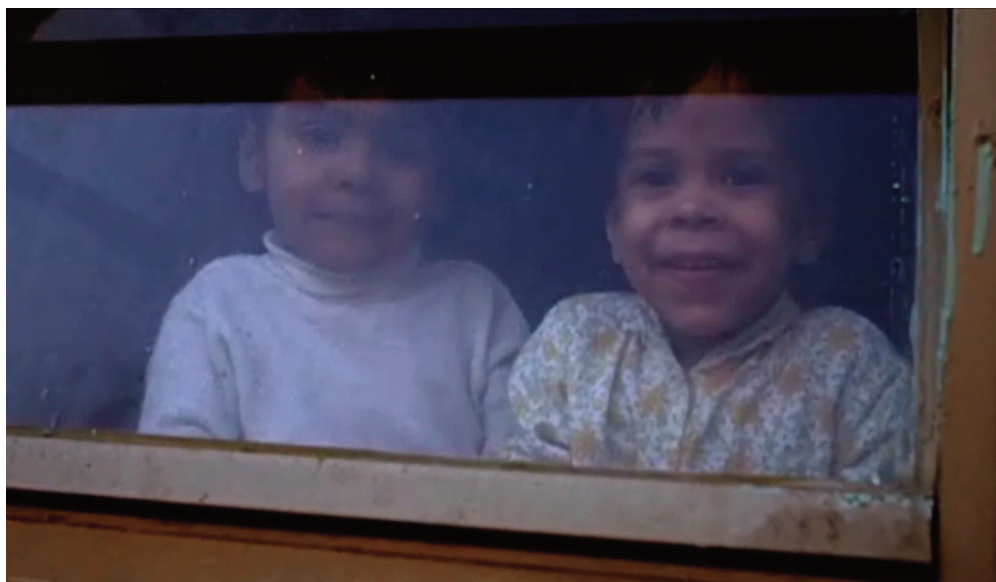
Il braccio violento della legge, 1971, William Friedkin.