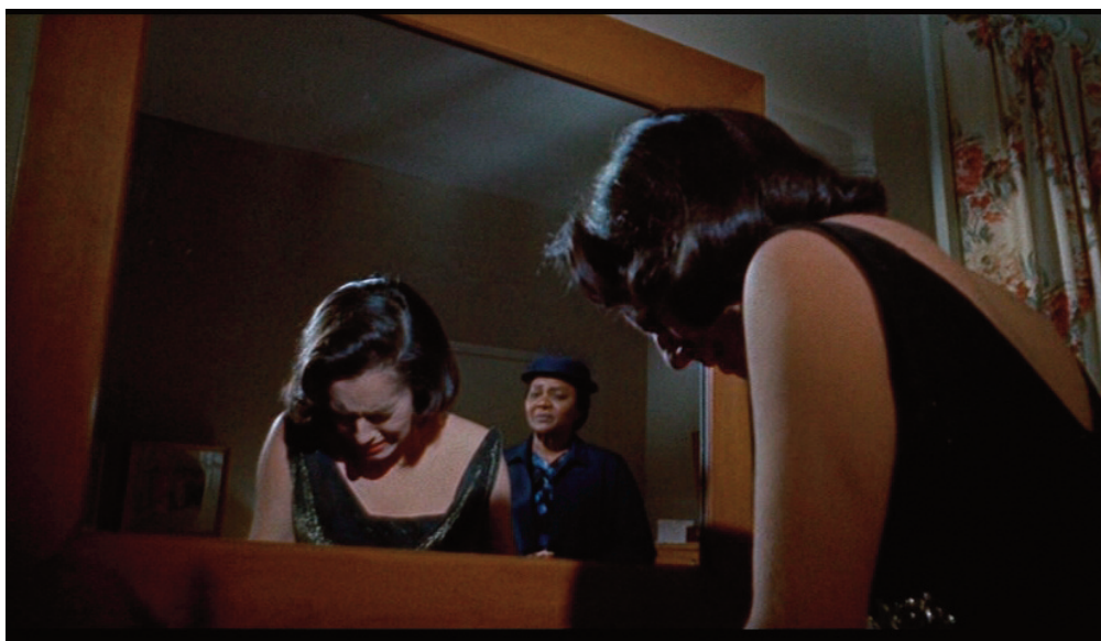
Lo specchio della vita , 1959, Douglas Sirk.