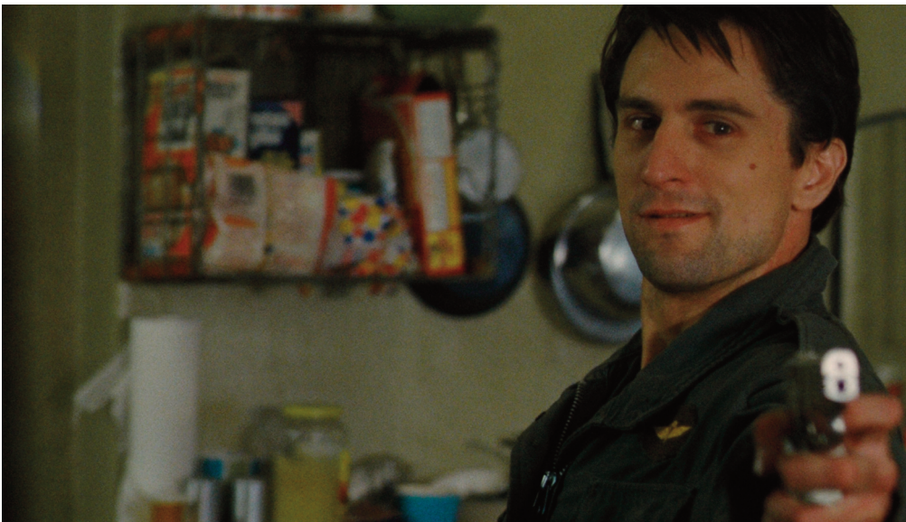
Taxi Driver , 1976, Martin Scorsese.