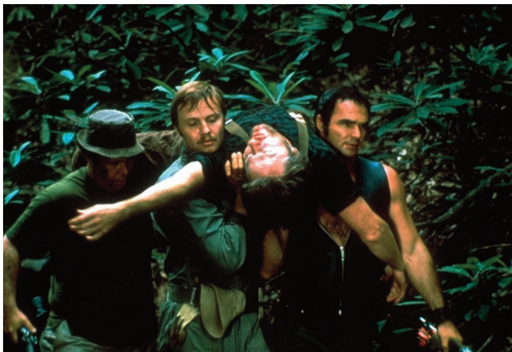
Un tranquillo weekend di paura, 1972, John Boorman.