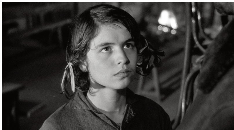
Mouchette, 1967, Robert Bresson.