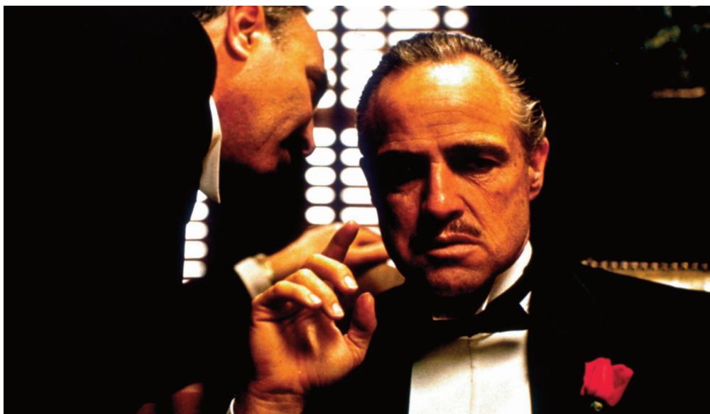
Il Padrino , 1972, Francis Ford Coppola.