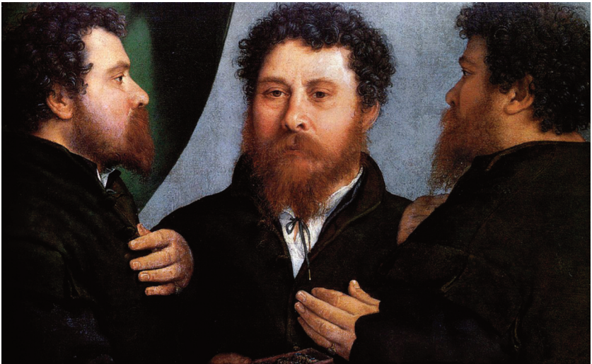
Lorenzo Lotto, Ritratto di Orefice , 1530 ca., olio su tela 52,1x79,1 Vienna, Kunsthistorisches Museum.

Nel ritratto pittorico esiste una tradizione che realizza contemporaneamente differenti punti di vista del soggetto, come avviene nel Ritratto di Orefice di Lorenzo Lotto qui sopra.