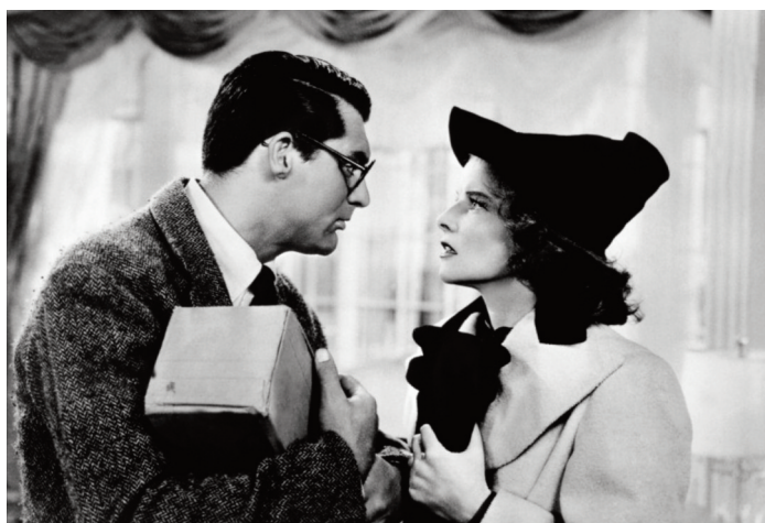
Susanna! , 1938, Howard Hawks.