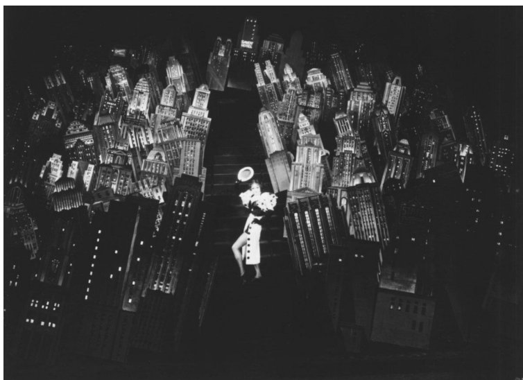
Quarantaduesima strada , 1933, Lloyd Bacon.