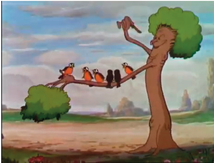
Fiori e alberi, 1932, Burt Gillett.