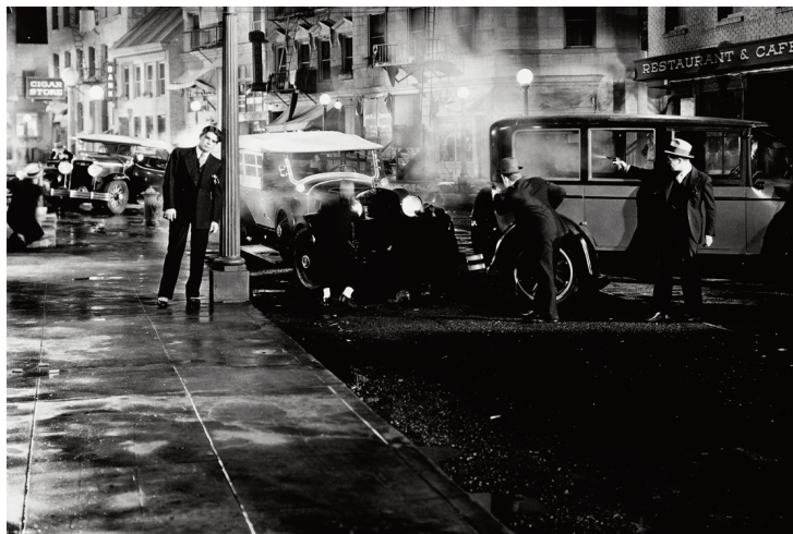
Scarface, Scarface, 1932, Howard Hawks e Richard Rosson.