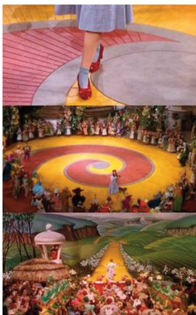
I movimenti di camera verso l'alto nel Mago di Oz , 1939, Victor Fleming.