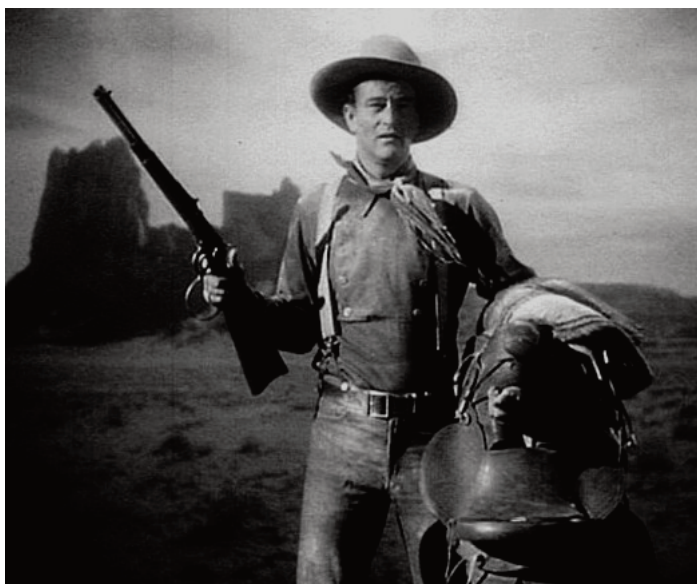
Ombre rosse , 1939, John Ford.