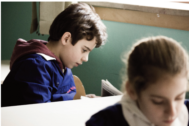
Fig. 9.3 – In alto, grafica giornale nel film Il bambino di vetro . In basso, due foto di scena (di Monica Maniscalco) in cui è visibile il giornale.