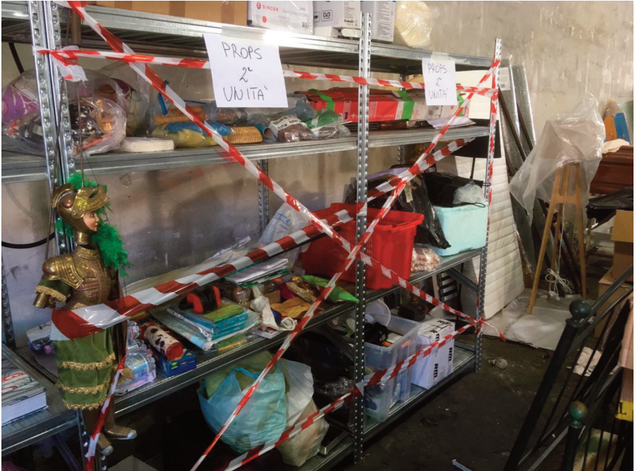
Fig. 9.2 – Props ricordati per la serie Anna .