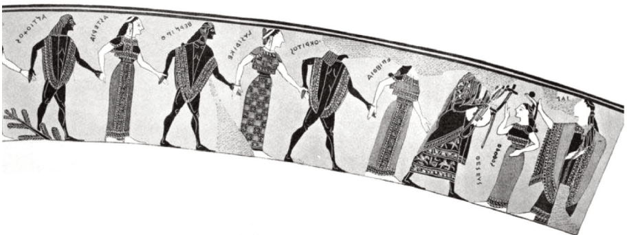
Fig. 2 – La fila “a catena” della gbéranos danzata a Delo dai quattordici giovanetti ateniesi liberati da Teseo. Nella parte destra si può vedere l’eroe che conduce la danza al suono della lyra . Il dipinto si trova nel collo del cratere attico a volute a figure nere detto Vaso François (570 a.C. ca.), conservato a Firenze, Museo archeologico nazionale.

In ragione della ripetizione annuale nel tempio sacro ad Apollo, la gbéranos si inserisce inoltre tra le danze iniziatiche , perché per i giovani ateniesi rappresentava il rito di passaggio dall’infanzia all’età adulta. Infatti il disegno a spirale della danza richiamava esplicitamente i due sensi di rotazione: uno, dall’esterno verso il centro, era simbolo di morte, l’altro, dal centro verso l’esterno, era simbolo di vita. Nella danza i giovanetti e le giovanette compivano un metaforico viaggio agli inferi e una volta raggiunto il centro, che rappresentava una morte simbolica, si avviavano verso la rinascita, uscendone a nuova vita.