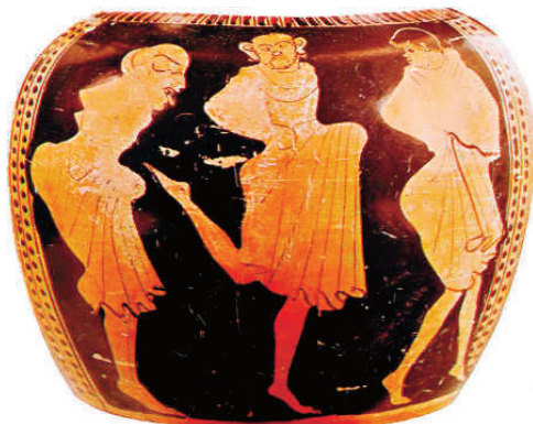
Fig. 8 – Tre uomini danzano il kórdax travestiti da satiri. Sotto alle vesti sollevate fino alle ginocchia si intravedono dei grossi falli, tipici nelle raffigurazioni dei satiri in quanto simbolici della fertilità e protagonisti delle processioni falloforiche che hanno dato origine alla commedia.

commedia siano da ravvisare nei cortei comastici delle Falloforie – chiamati anche Processioni Falloforiche – caratterizzati dall’ostentazione di grossi falli perché vi si invocava la fertilità della terra e di tutti gli esseri viventi.