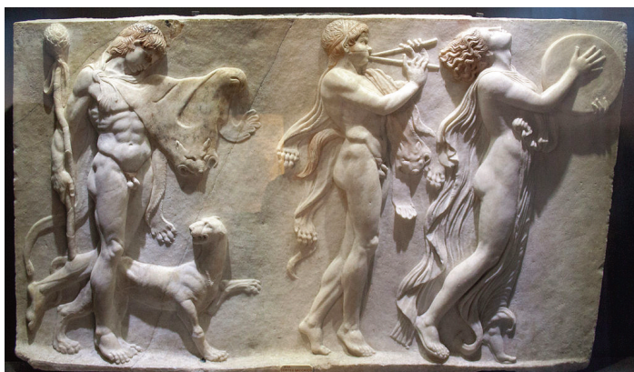
Fig. 5 – Raffigurazione scultorea di un thiásos dionisiaco : il dio Dioniso (a sinistra) è preceduto nel corteo da un satiro che suona un diaulós e una menade che danza suonando un tympanon . Bassorilievo romano del I secolo d.C., Napoli, Museo archeologico nazionale.

In origine il ditirambo era un canto ritmico e ossessivo , perlopiù improvvisato e scandito dal suono degli aulói e dei tympanoi . Gli adepti si abbandonavano alla danza ebbri di vino, eseguendo movimenti vorticosi, scomposti e violenti . Oltre alla danza sfrenata e liberatoria, i riti prevedevano lo sparagmós (da sparaxis , lacerazione) seguito dall' omophagía (da omós , crudo e faghêin , mangiare), ossia l'uccisione a mani nude tramite smembramento di un animale selvatico, che veniva poi sbranato ancora caldo e sanguinante. Il rito aveva lo scopo di raggiungere quello speciale stato di possessione, produttore di energia vitale, che i greci chiamavano enthousiasmós (entusiasmo), etimo che rimanda all'idea dell'invasamento divino, in quanto composto da en , dentro e theós , dio: "avere un dio dentro di sé". Tale possessione portava all' estasi dionisiaca , ovvero la fuoriuscita da se stessi prodotta dall'unione col dio (estasi: da ex , fuori, e stasis , stare, quindi "stare/essere fuori di sé"). Il corteo dei seguaci del dio, chiamato thiásos , si spingeva fino sui boschi delle montagne ed era composto dalle menadi , in greco mainades , termine collegato alla parola manía che indi-