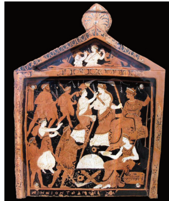
Fig. 11 – Rappresentazione del rituale dei Mysteria Eleusinia : gli iniziati procedono in processione illuminando la cerimonia notturna con delle fiaccole e vengono accolti dalla dea Demetra, seduta su di un cesto contenente oggetti sacri, e da sua figlia Persefone che impugna una fiaccola.

Possono essere considerate dionisiache anche le danze eseguite durante i Mysteria (Misteri), cerimonie di iniziazione al culto di una divinità. Già alla fine del V secolo a.C. erano stati introdotti i caratteri della possessione dionisiaca nei Mysteria Eleusinia (Misteri Eleusini), che si svolgevano nel santuario della città di Eleusi dedicato a Demetra e Persefone, dee della fertilità della terra e quindi molto vicine a uno degli attributi di Dioniso. I riti misterici erano caratterizzati dalla segretezza, e chi vi partecipava intendeva entrare a far parte del gruppo chiuso degli iniziati per ricevere benefici permanenti in vita e dopo la morte. Pertanto le cerimonie si svolgevano di notte e in luoghi lontani dalla città (Fig. 11).