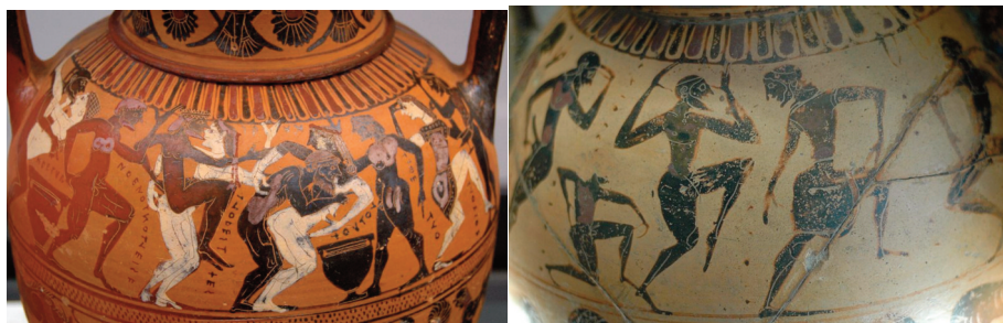
Fig. 7 – A sinistra: scena orgiastica di un kómos , anfora a figure nere del 560 a.C. ca., Monaco di Baviera, Museo nazionale delle collezioni antiche. A destra: danza srenata di comasti, anfora attica a figure nere del 550 o 540 a.C., Parigi, Museo del Louvre.

Si ritiene che i canti e le danze eseguiti nei kómos siano la base del genere teatrale della commedia . Ciò è avvalorato da quanto riferisce Aristotele nella Poetica (334-330 a.C. ca.), ossia che il termine “commedia” (in greco como-día ) deriverebbe dall’unione delle voci kómos e odé (canto), quindi significherebbe “canto del kómos ”. Sembra accertato comunque che le origini della