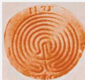
Fig. 1 – Moneta di Cnosso (V secolo a.C.) che raffigura un labirinto su uno dei due versi.

Pasifae, moglie del re Minosse, a causa di una maledizione del dio Poseidone (o della dea Afrodite secondo un'altra versione), si era accoppiata con un toro e aveva partorito il Minotauro, un mostro per metà uomo e metà toro che si nutriva di carne umana. Perciò Minosse lo aveva fatto rinchiedere nel labirinto (Fig. 1), costruito dall'architetto Dedalo apposta per questo scopo, e dopo aver vinto la guerra contro Atene, aveva ordinato che ogni anno quattordici giovani ateniesi (sette maschi e sette femmine) fossero inviati a Creta per sfamarlo. In occasione della terza spedizione sacrificale, Teseo, figlio di Egeo re di Atene, si offrì di unirsi ai giovani allo scopo di uccidere il mostro. Giunto a Cnosso, Arianna, figlia di Minosse, si innamorò di lui e lo aiutò nel modo di ritrovare la via d'uscita dal labirinto dandogli una matassa di filo di lana (il celebre “filo di Arianna”) che, legata all'ingresso con un capo e poi srotolata, gli avrebbe permesso di seguire a ritroso le proprie tracce. Raggiunto il Minotauro, Teseo lo uccise con una spada e, grazie all'espeditore di Arianna, poté uscire dal labirinto assieme ai giovani ateniesi. Si imbarcò quindi verso Atene, ma stando a quanto riferisce il filosofo Plutarco nelle Vite parallele (II secolo d.C.), dapprima fece tappa nell'isola di Delo, dove organizzò i festeggiamenti per la riuscita dell'impresa, che comprendevano una gara atletica e la danza dei quattordici giovani in onore di Apollo 4 .