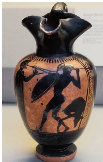
Fig. 4 – Guerriero che danza la pirrica durante le Panatennee con l'accompagnamento dell' aulós a due canne. Oinochoe attica del 490 a.C. ca. attribuita al Pittore di Athena.

Essa imita le mosse di difesa da ogni colpo e lancio, attraverso le parate, la ritirata, il salto in alto e l'abbassarsi, e imita anche le mosse contrarie, cioè quelle con cui ci si dispone in figure d'attacco, cercando di imitare mimicamente i lanci di frecce e giavellotti e ogni genere di colpo. 7