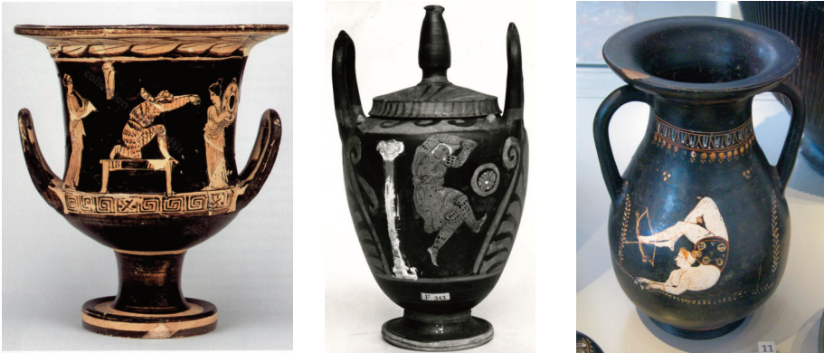
Fig. 10 – A sinistra: una donna in abito orientale danza l' óklasma sopra a un tavolo, mentre altre due suonano rispettivamente un aulós e un tympanon (cratere a calice a figure rosse proveniente dalla Beozia, 385 a.C. ca.). Al centro: danzatrice di óklasma in un vaso nuziale ( lebes gamicós ) a figure rosse del IV secolo a.C. (Londra, British Museum). A destra: figura acrobatica che consiste nel lanciare una freccia con i piedi (vaso del tipo peliké , stile ceramico di Gnathia a figure bianche, 325 a.C. ca.).