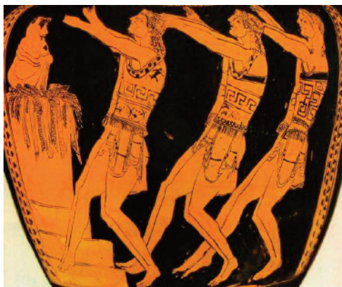
Fig. 6 – Probabile rappresentazione di una tyrbasía , eseguita da tre coppie di coreuti intorno al thyméle con il simulacro di Dioniso (a sinistra).

Si ritiene che il ditirambo sia la base della nascita della tragedia greca . A partire dal VI secolo a.C. i riti orgiastici in onore di Dioniso sono stati sostituiti gradualmente da rituali simbolici meno cruenti, ma sempre collegati al ritmo di questo canto. Infatti, nell’epoca della civiltà agricola, il culto di Dioniso veniva associato alle feste rurali dedicate al vino, quali la vendemmia, la pigiatura dell’uva, la degustazione e infine la morte annuale della vigna, officiata come la morte del dio. Durante queste feste si intonava ancora il ditirambo , sempre considerato l’inno sacro a Dioniso, ma non più nella sua primitiva forma improvvisata dagli adepti dei riti estatici, bensì trasformato in una struttura prestabilita e scritta in versi. Era anche previsto il sacrificio di un capretto , uno degli animali sacri al dio 9 , eseguito sopra un piccolo altare chiamato thyméle . Di conseguenza il ditirambo che accompagnava il sacrificio ha preso il nome di tragodía (tragedia), termine che alla lettera significa “ canto del capro ”, in