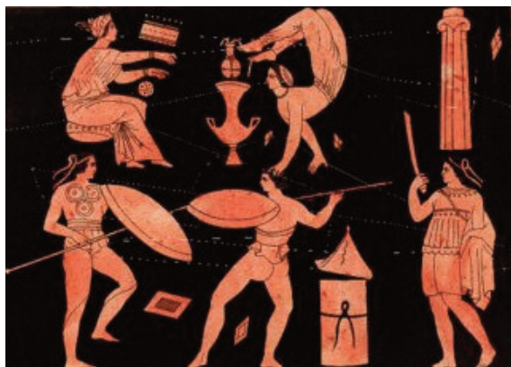
Fig. 3 – Litografia acquerellata, tratta da un vaso greco della collezione di sir William Hamilton, che raffigura gli allenamenti per danzare la pirrica . Oltre ai gesti del combattimento (in basso), si eseguono figure acrobatiche (in alto).

Questa danza va inserita anche tra le danze didattiche , in quanto gli spartani, popolo guerriero per eccellenza, la ritenevano un elemento essenziale dell’educazione dei giovani maschi come preparazione militare . I bambini