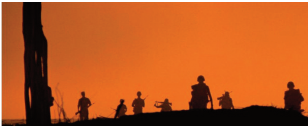
Nato il quattro luglio, 1989, Oliver Stone.