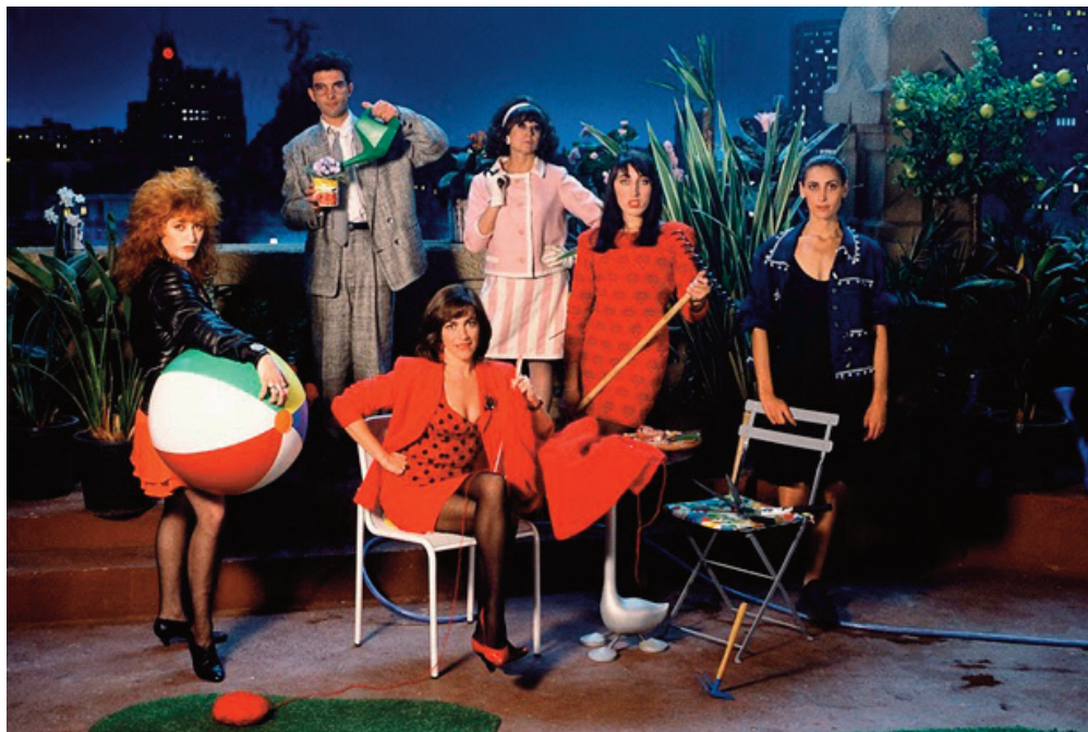
Donne sull'orlo di una crisi di nervi, 1988, Pedro Almodóvar.