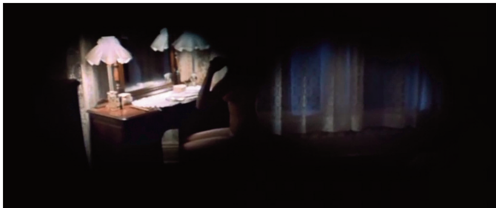
Il piano sequenza introduttivo di Halloween , 1978, John Carpenter.