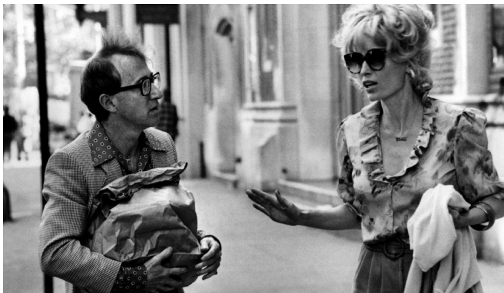
Broadway Danny Rose , 1984, Woody Allen.