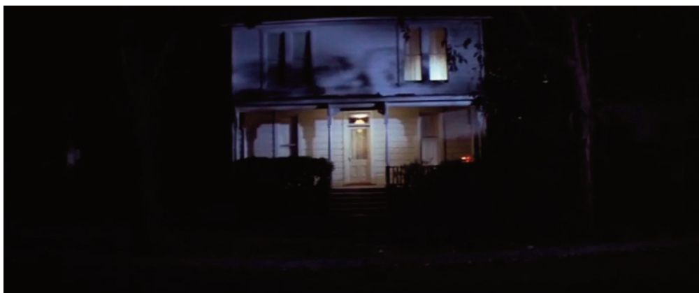
Il piano sequenza introduttivo di Halloween , 1978, John Carpenter.