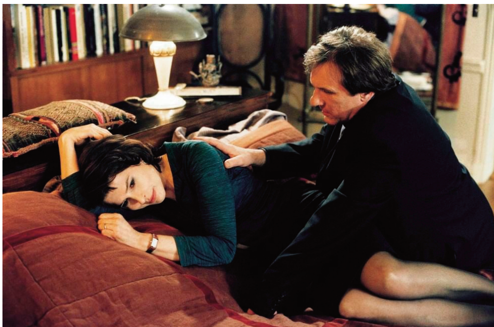
La signora della porta accanto , 1981, François Truffaut.