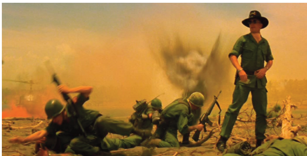
Apocalypse Now , Francis Ford Coppola.