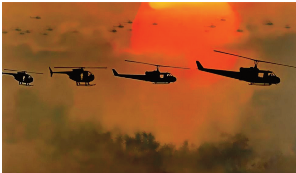
Apocalypse Now , 1979, Francis Ford Coppola.