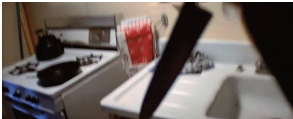
Il piano sequenza introduttivo di Halloween , 1978, John Carpenter.