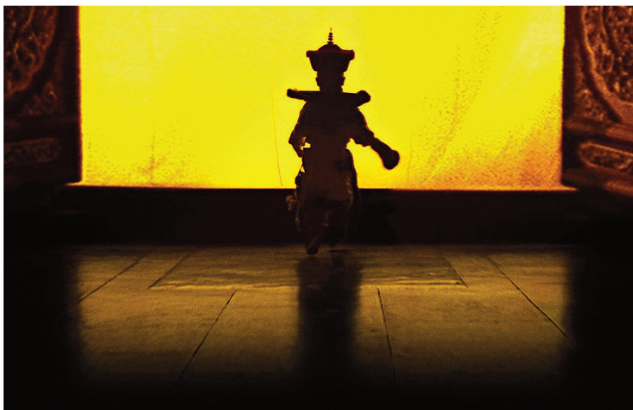
L'Ultimo imperatore, 1987, Bernardo Bertolucci.