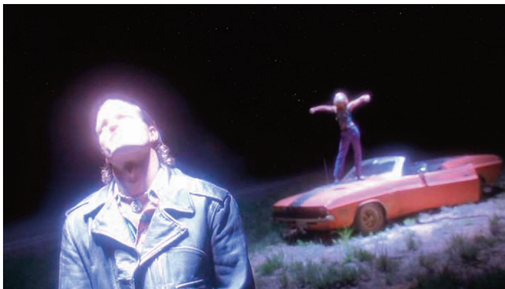
Assassini nati , 1994, Oliver Stone.