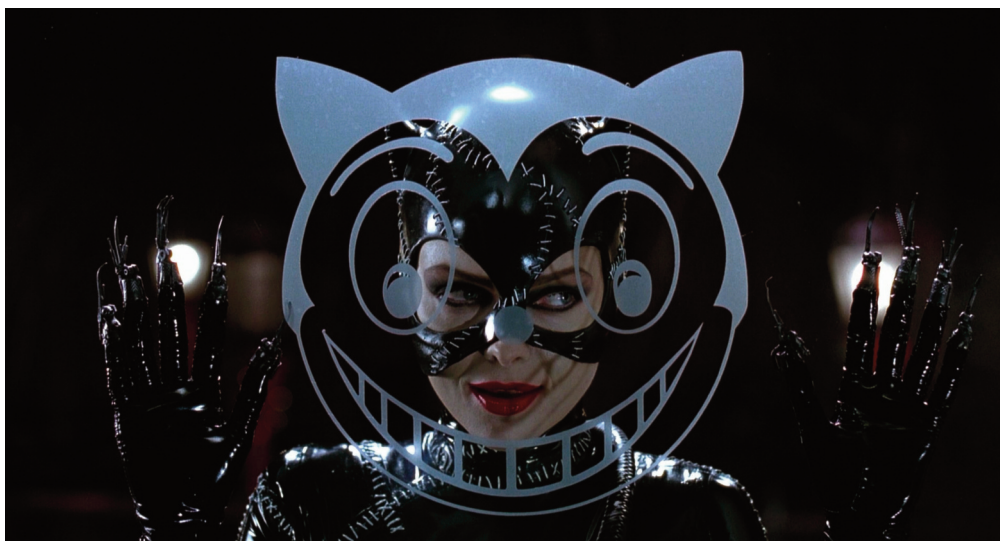
Batman , 1989, Tim Burton.