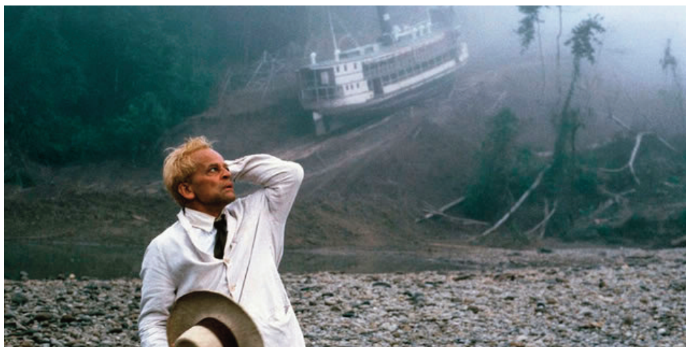
Fitzcarraldo , 1982, Werner Herzog.