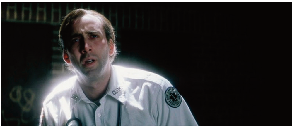
Al di là della vita , 1999, Martin Scorsese.