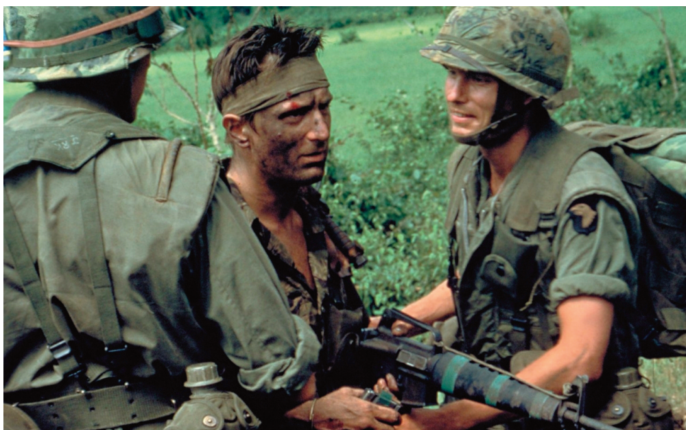
Il cacciatore , 1978, Michael Cimino.