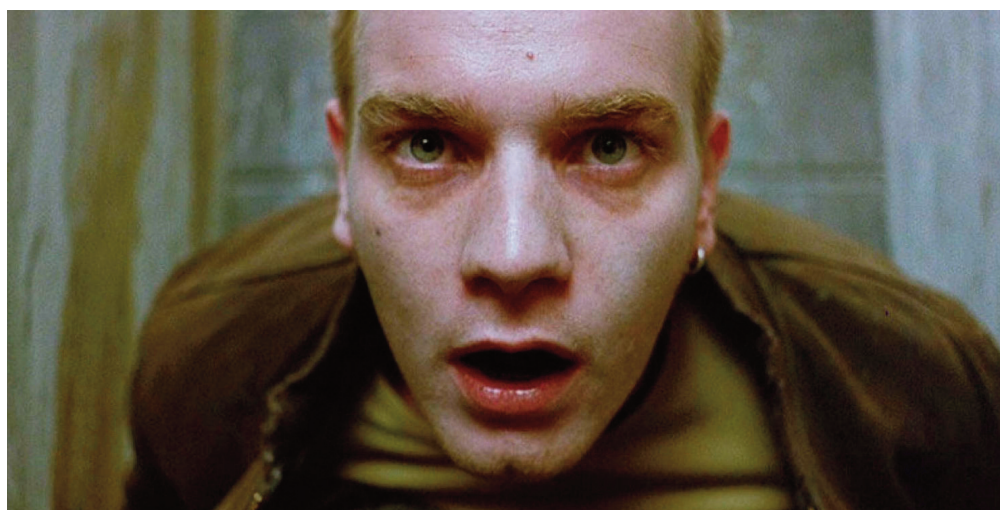
Trainspotting , 1996, Danny Boyle.