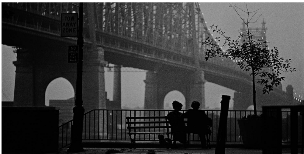
Manhattan , 1979, Woody Allen.