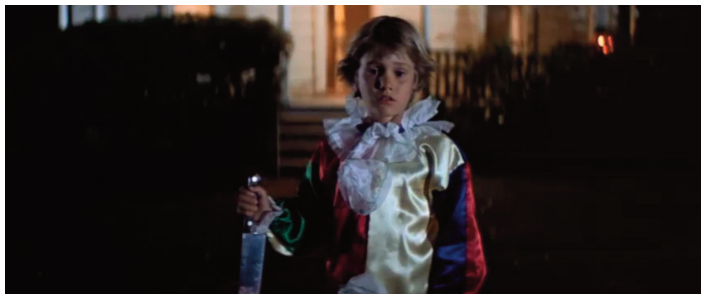
Il piano sequenza introduttivo di Halloween , 1978, John Carpenter.