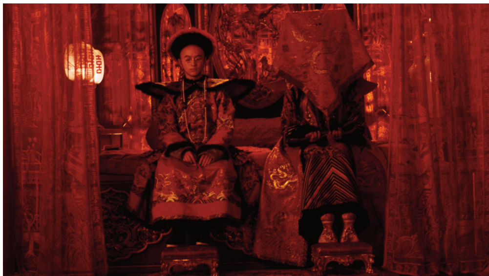
L'Ultimo imperatore, 1987, Bernardo Bertolucci.