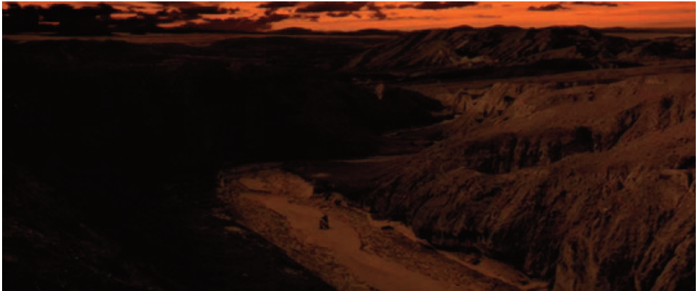
Guerre stellari , 1977, George Lucas.