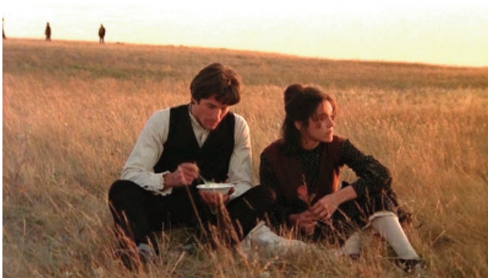
I giorni del cielo , 1978, Terrence Malick.