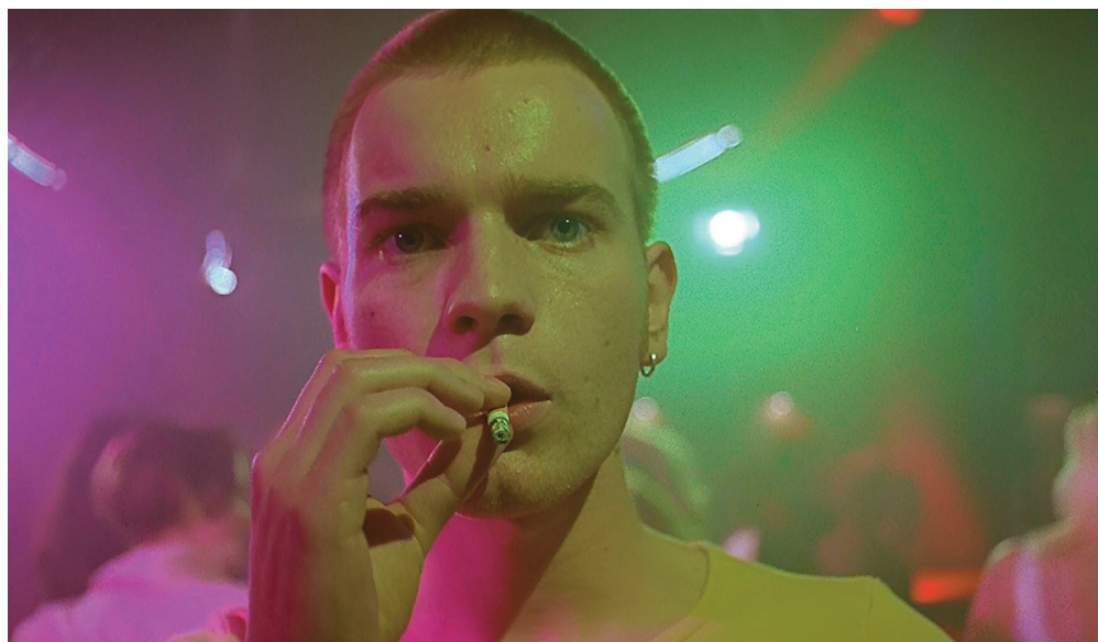
Trainspotting , 1996, Danny Boyle.