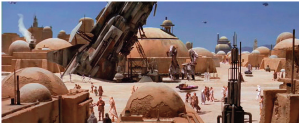
Guerre stellari , 1977, George Lucas.