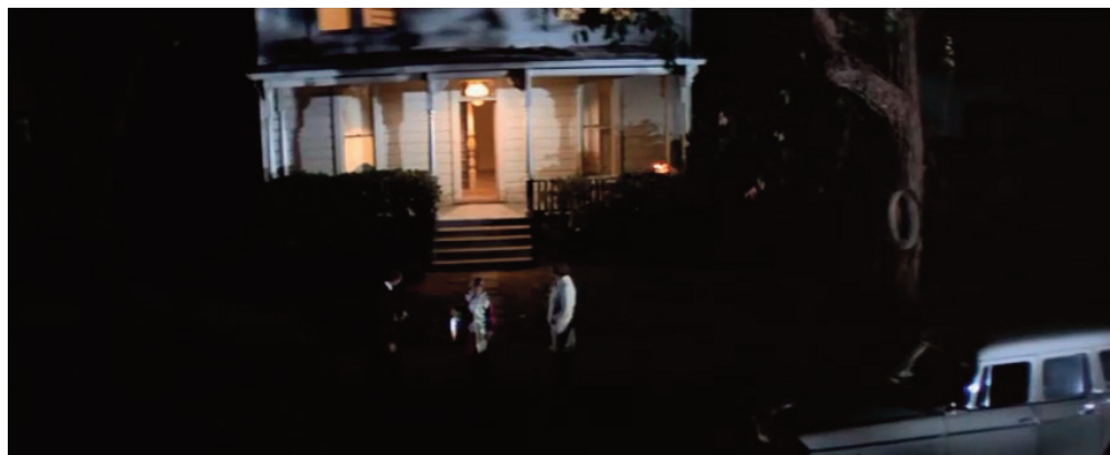
Il piano sequenza introduttivo di Halloween , 1978, John Carpenter.