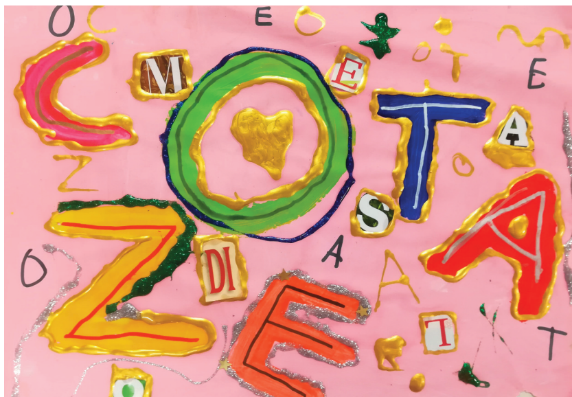
Fig. 5.23 (c e d) – Bambini di 5 anni, Giocare con le lettere , tecnica mista (tempera, pennarello, collage, glitter colorato).