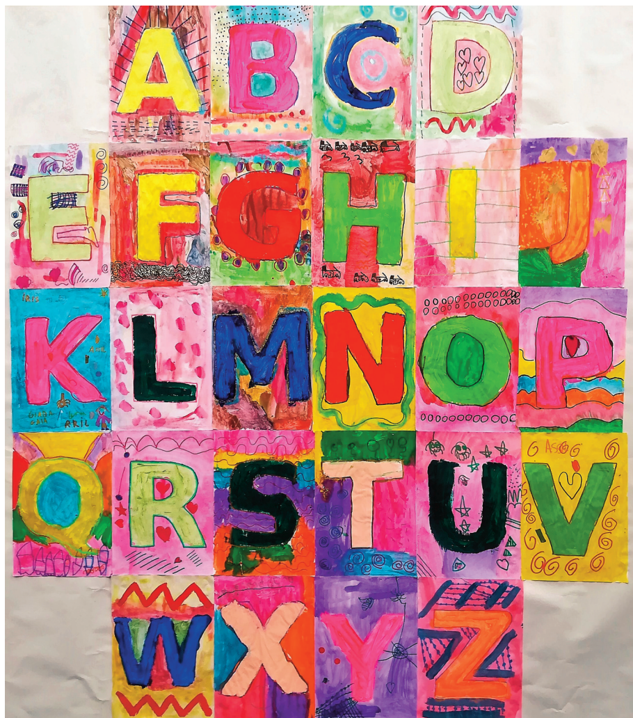
Fig. 5.25 – Bambini di 5 anni, Alfabeto , tecnica mista (acquerello, acrilico, pennarello).