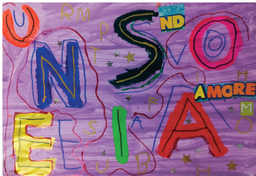
Fig. 5.23 (a e b) – Bambini di 5 anni, Giocare con le lettere , tecnica mista (tempera, pennarello, collage, glitter colorato).