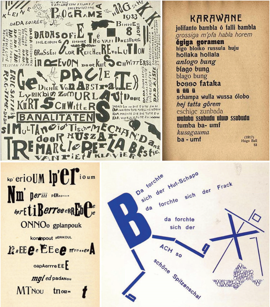
Fig. 5.26 – Manifesti dadaisti.