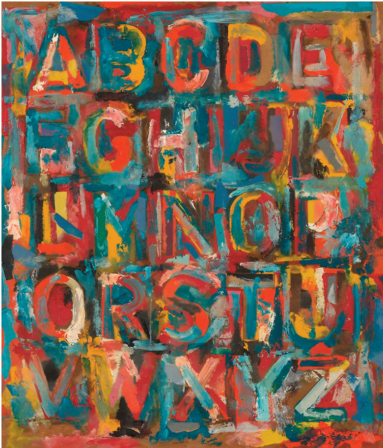
Fig. 5.22 – Jasper Johns, Alphabet , 1959, Art Institute of Chicago.