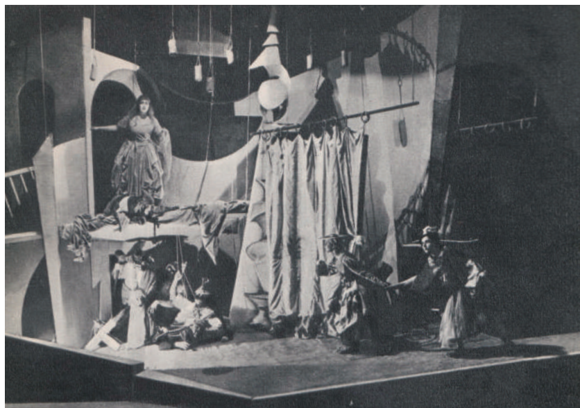
La Principessa Turandot – scena delle torture.