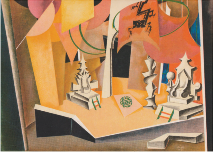
I. Nivinskij – bozzetto per la scenografia della Principessa Turandot .