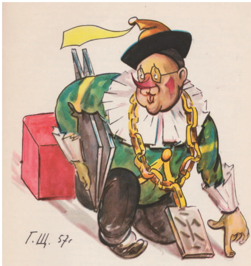
G.V. Ščukin – caricatura di Tartaglia interpretato da B.V. Ščukin.