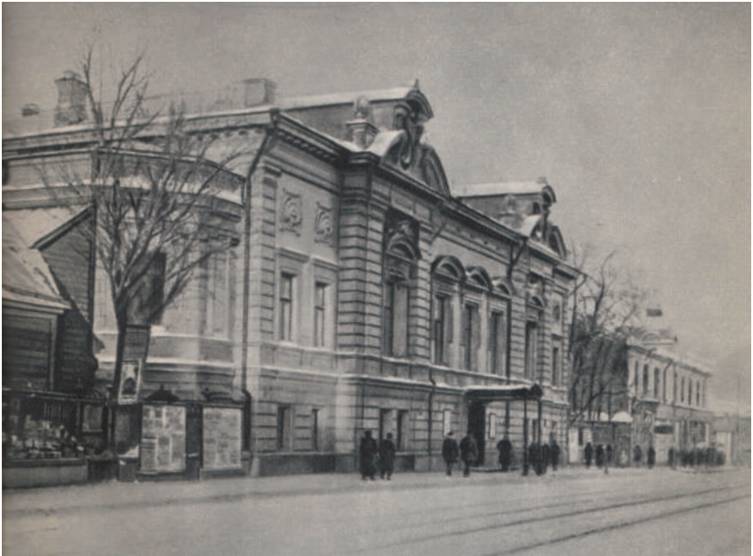
La villetta sull'Arbat nella quale era collocato il teatro.