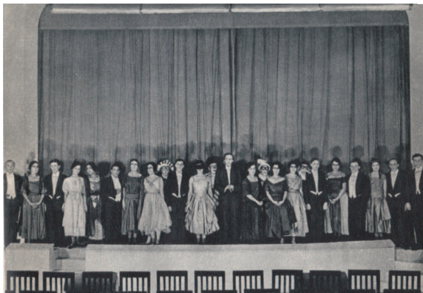
La principessa Turandot – parata dei partecipanti allo spettacolo.