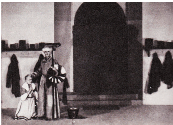
Il miracolo di sant'Antonio – Antonio e Virginia.