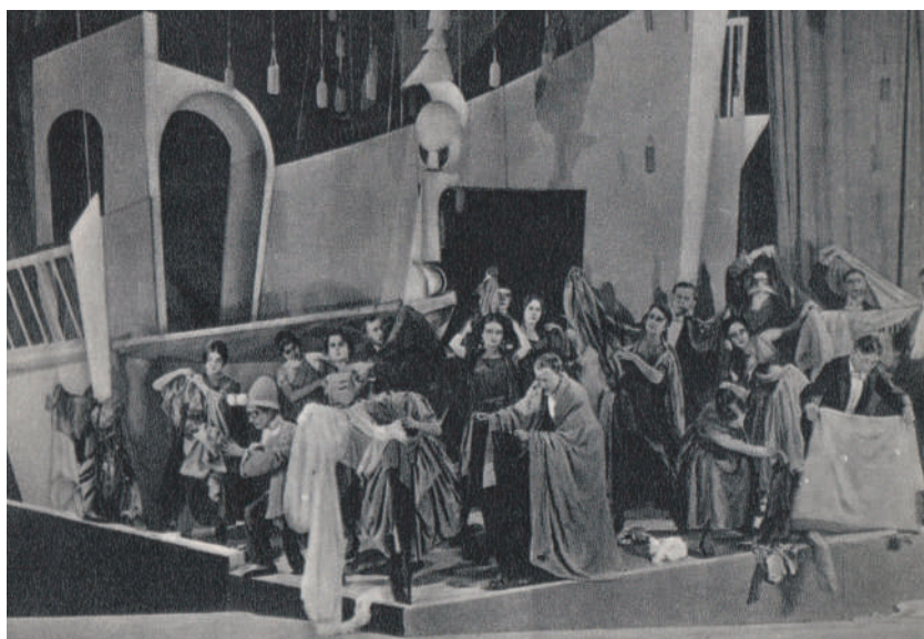
La principessa Turandot – i partecipanti allo spettacolo indossano i costumi.