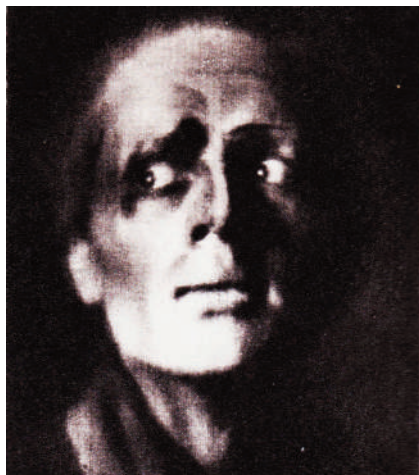
Il miracolo di sant'Antonio – Antonio nell'interpretazione Zavadskij.