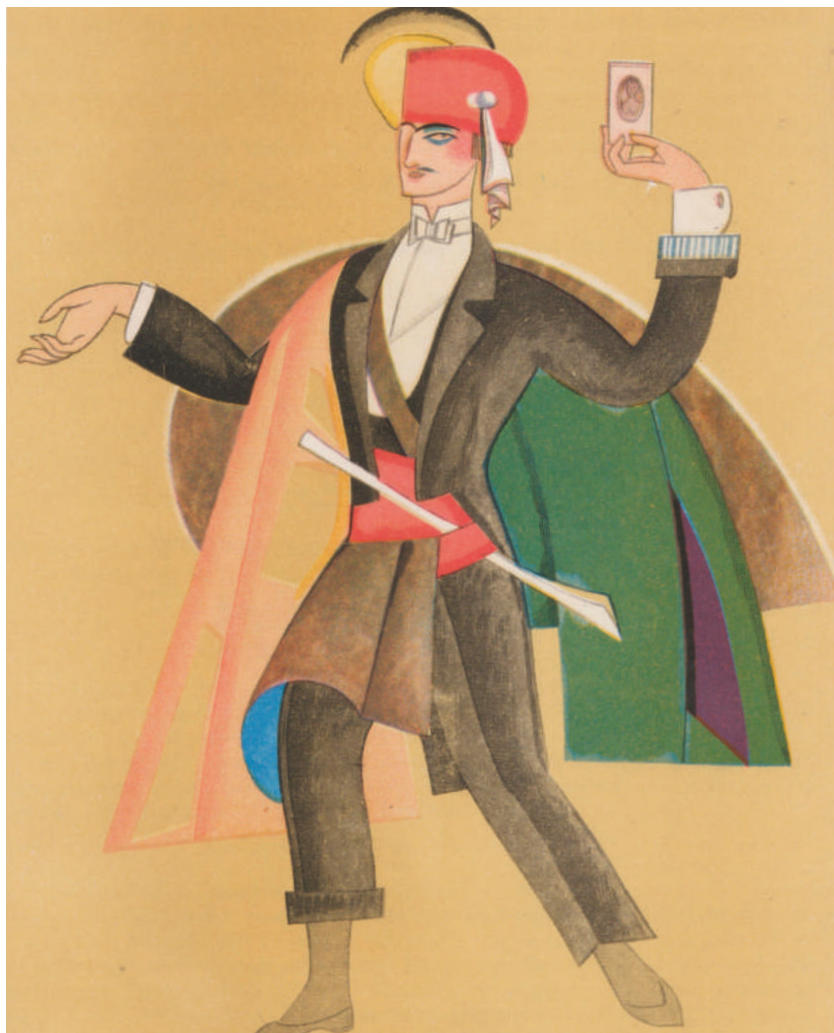
I. Nivinskij – bozzetto per il costume del principe Calaf.