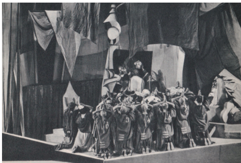
La Principessa Turandot – scena finale, il matrimonio.