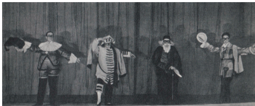
La Principessa Turandot – le quattro maschere presentano lo spettacolo.