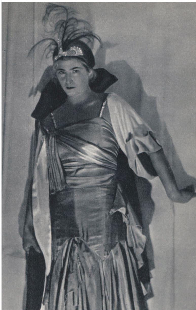
Turandot interpretata da Cecilia Mansurova.