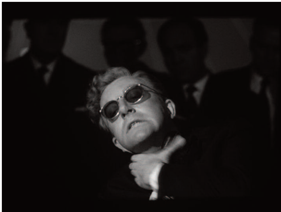
Fig. 36 – Il saluto romano si trasforma in un autostrangolamento.