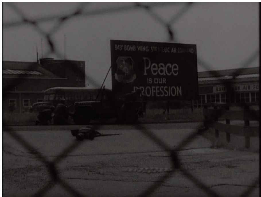
Fig. 20 – Un cartello intravisto da un reticolato ironizza sulla pace. Un fotogramma ancora attuale.