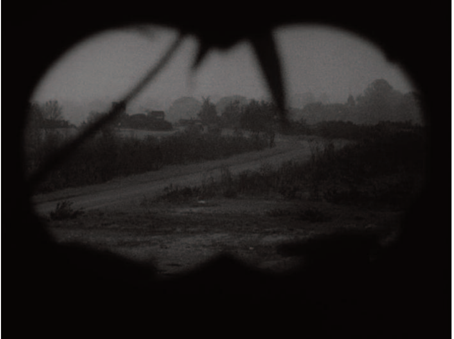
Fig. 15 – Un'immagine ricorrente nelle sequenze di guerra dei film di Kubrick: la soggettiva col binocolo.