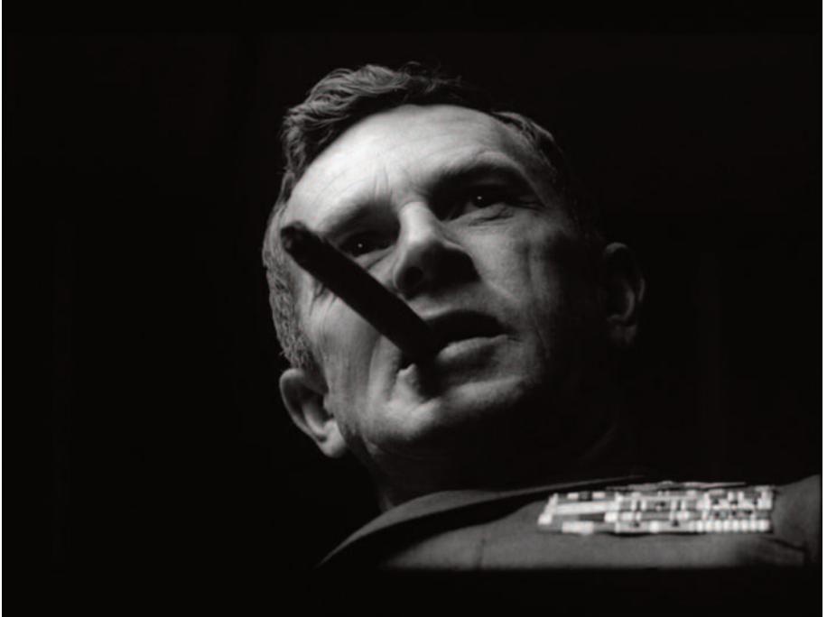
Fig. 11 – PP e inquadratura dal basso. Un'epica ironica.