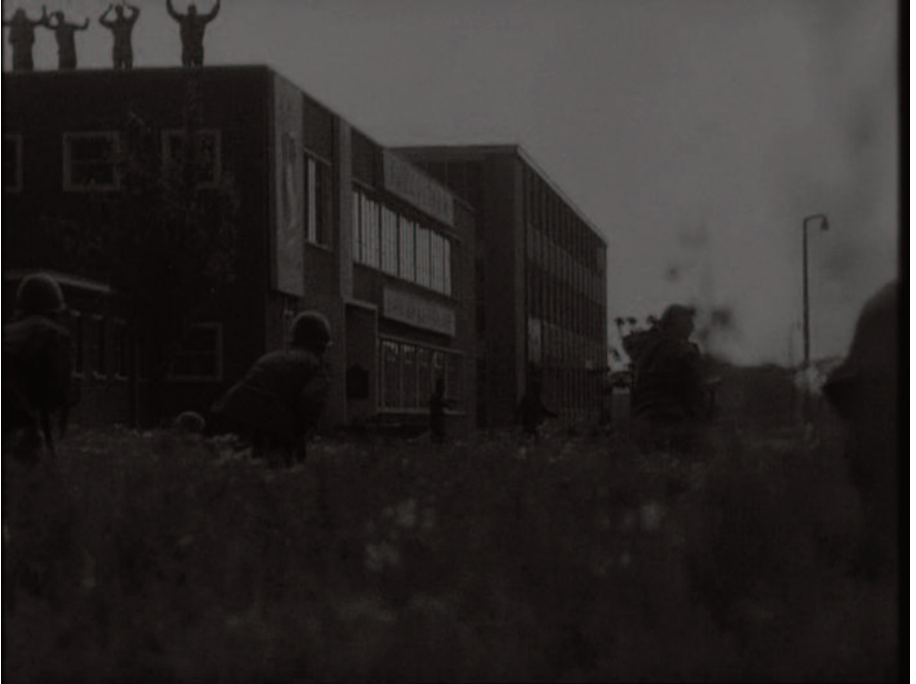
Fig. 21 – Una “vera” scena da war movie (la ritroveremo in Full Metal Jacket ).