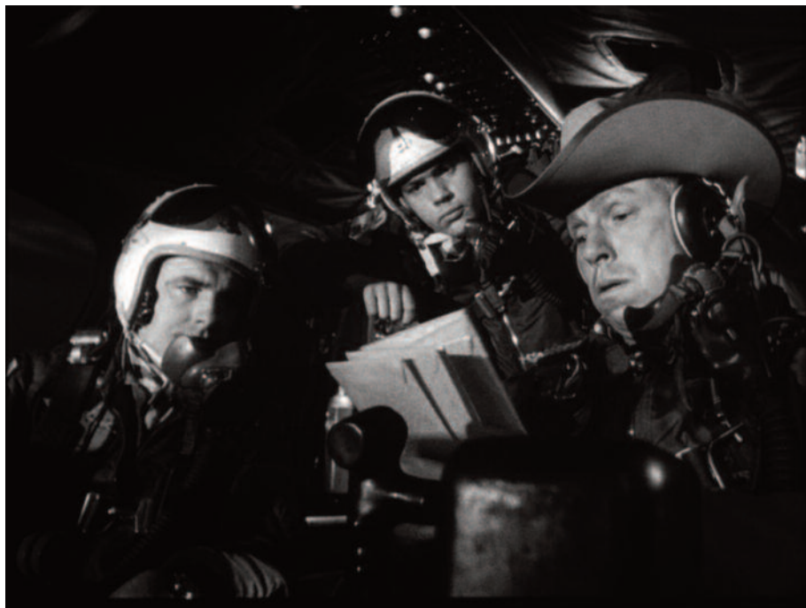
Fig. 10 – Composizione dell'inquadratura.