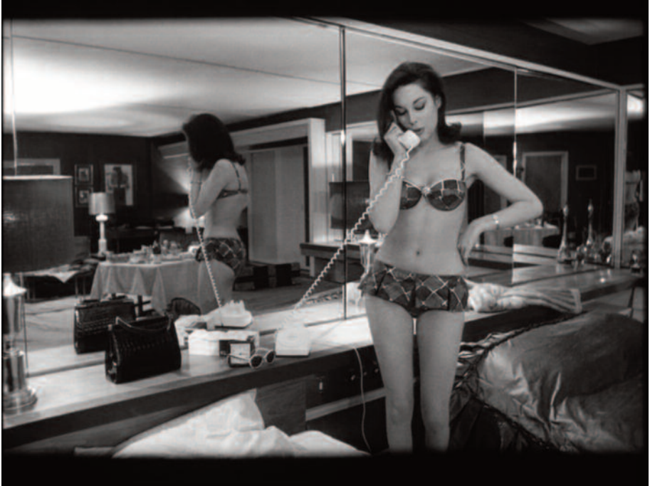
Fig. 7 – L'immagine riflessa: corpi erotici allo specchio.