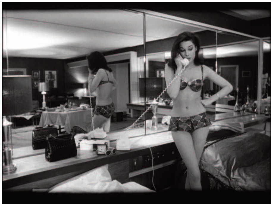
Fig. 8 – Il doppio (1).