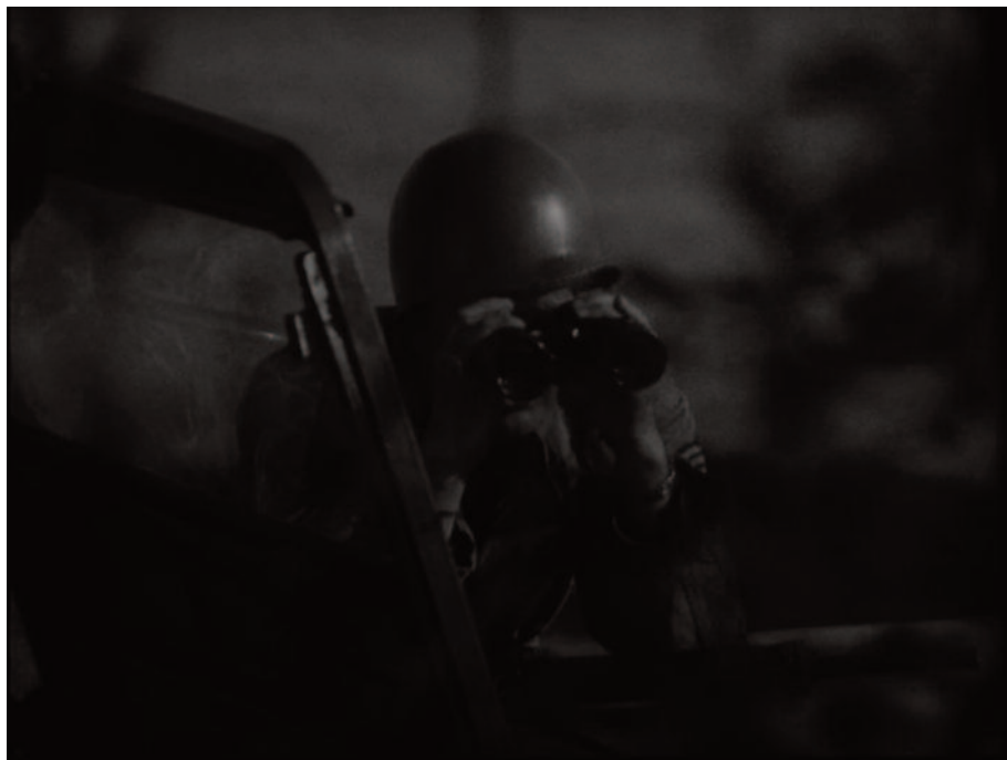
Fig. 16 – Lo sguardo al binocolo.