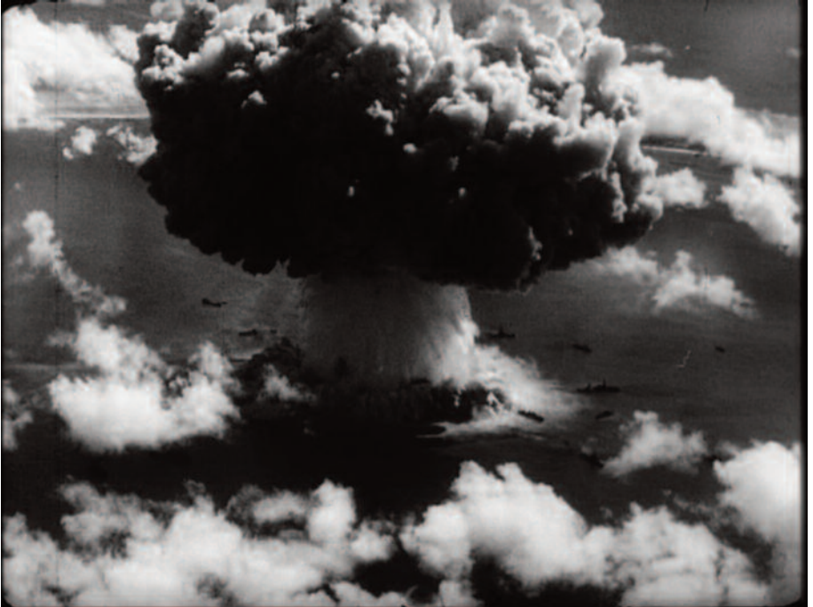
Fig. 41 – La danza della bomba (4).