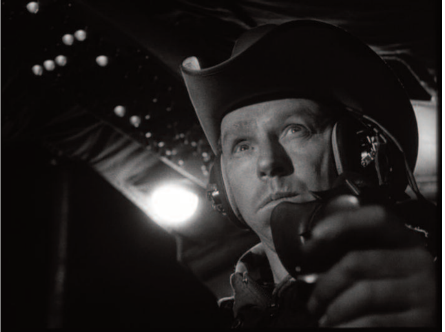
Fig. 23 – PP del pilota/cowboy.