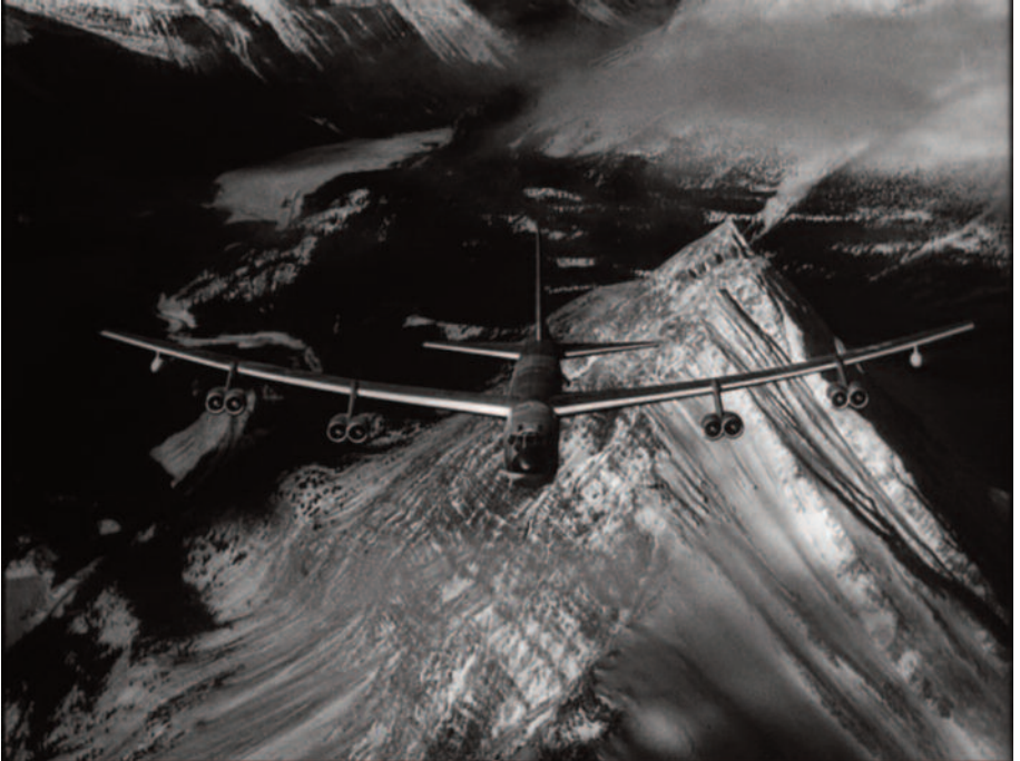
Fig. 5 – Il minaccioso aereo.