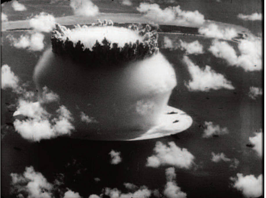
Fig. 39 – La danza della bomba (2).