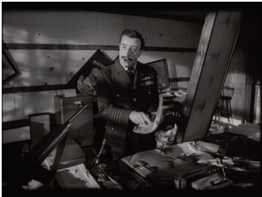
Fig. 24 – Ancora una prestazione da trasformista.