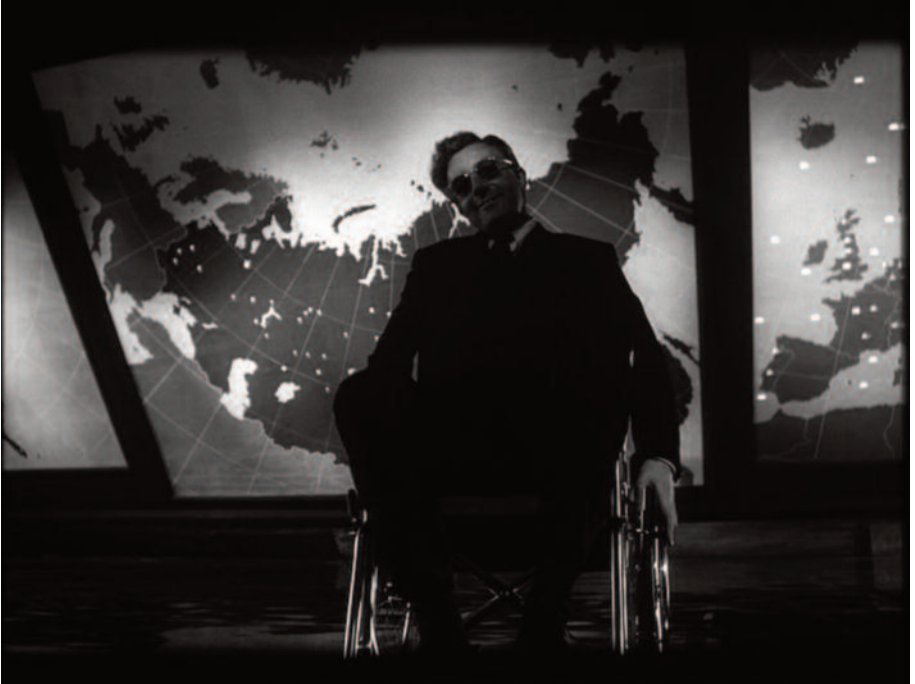
Fig. 31 – In silhouette, Peter Sellers gigioneggia.