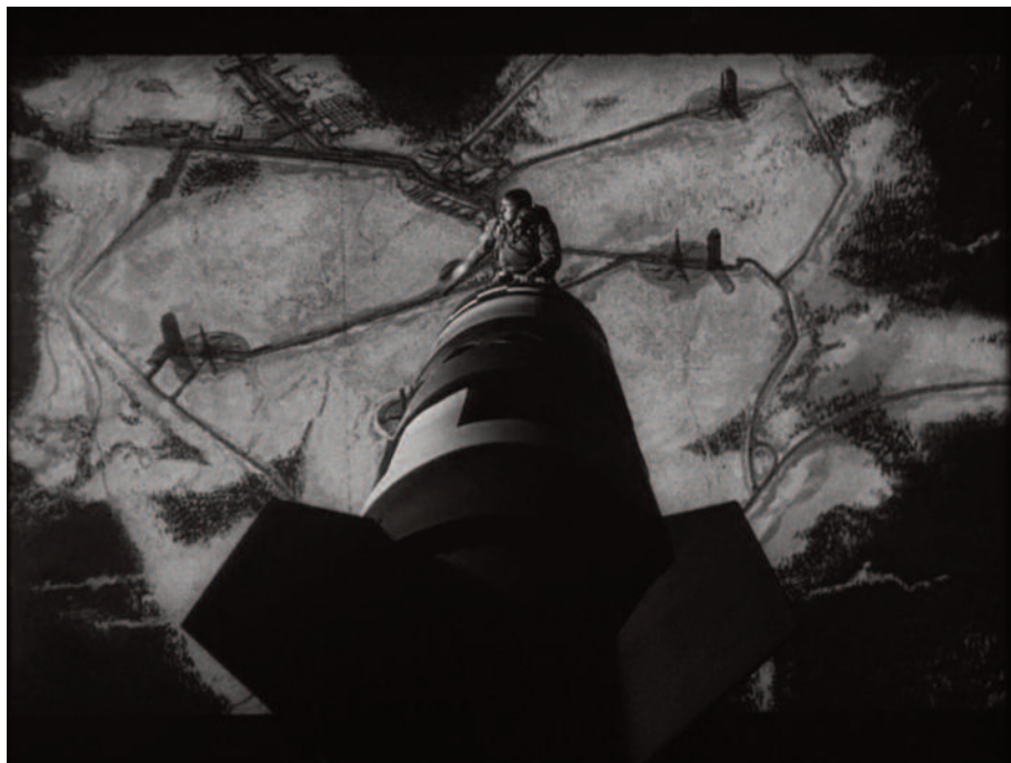
Fig. 28 – Una delle più celebri inquadrature di Kubrick: “King” Kong cavalca la bomba (3).