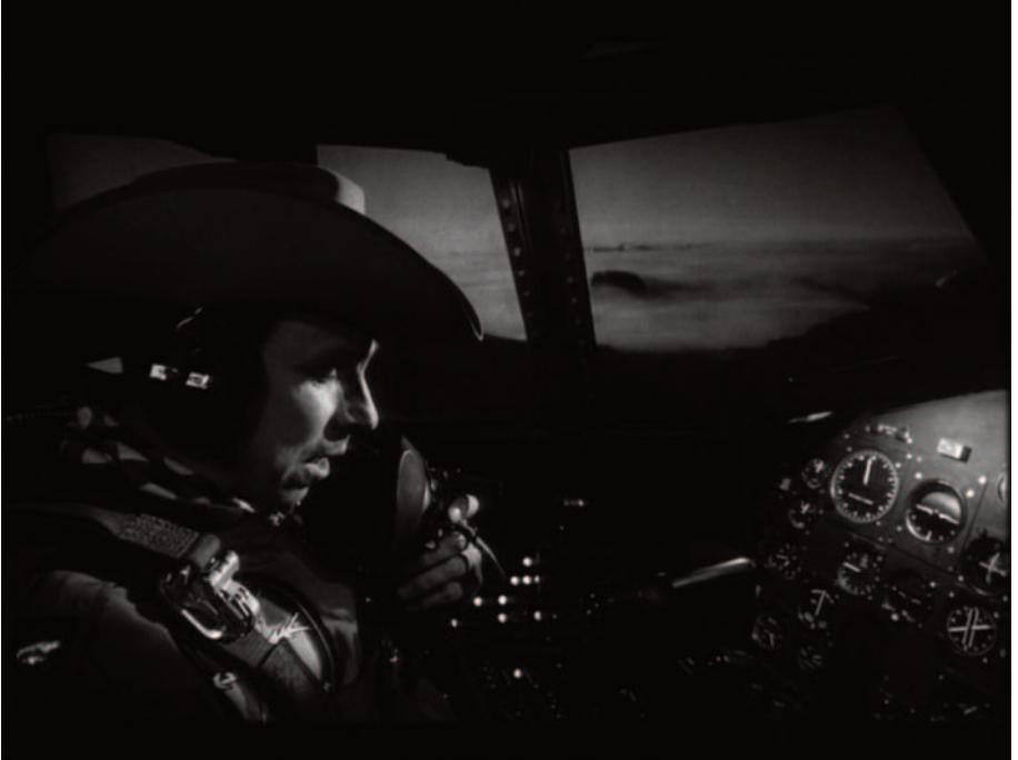
Fig. 6 – Il pilota-cowboy.