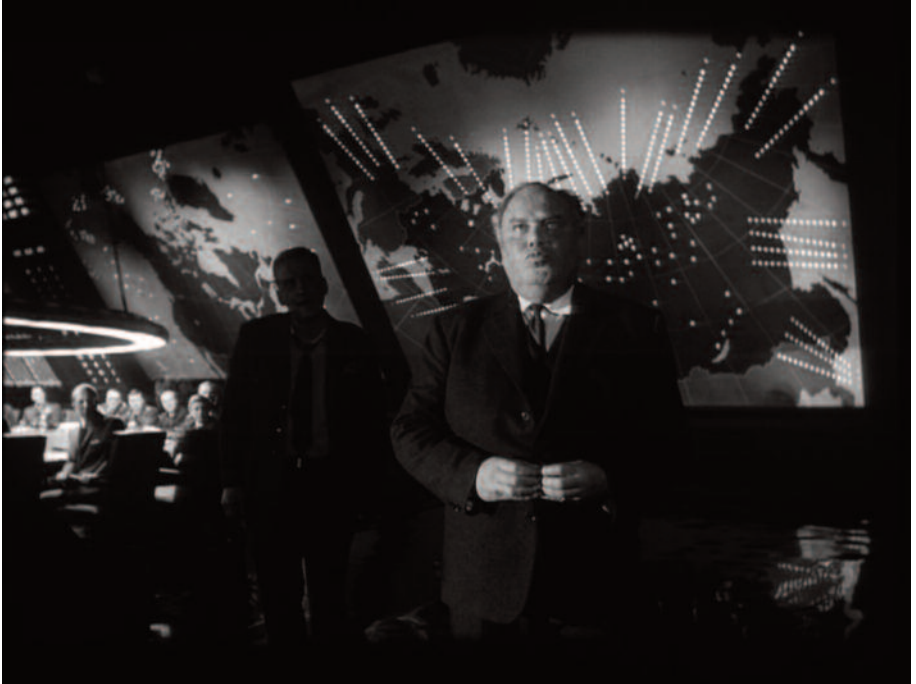
Fig. 17 – La forma al servizio dell'ironia: fuga di ombre e di spazi.