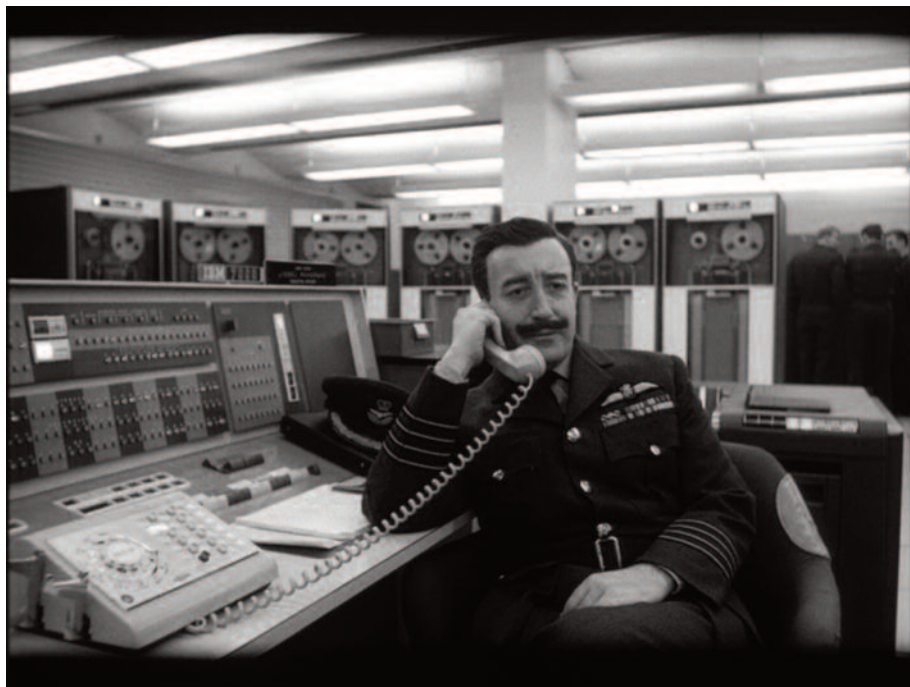
Fig. 3 – Il trasformista Peter Sellers impegnato, come in Lolita , in molteplici ruoli (1).