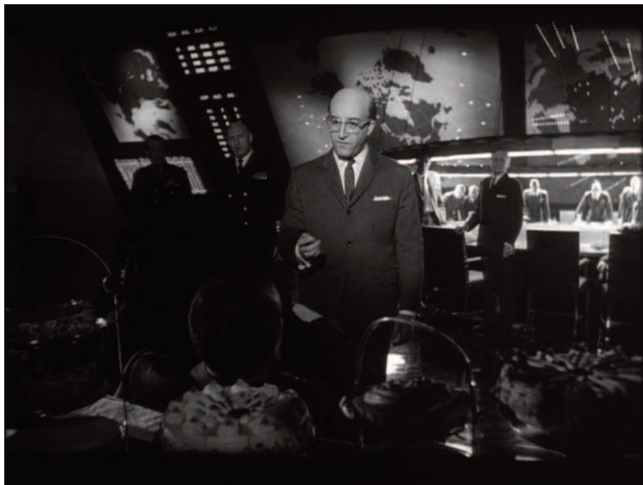
Fig. 14 – Bella inquadratura con profondità di campo.