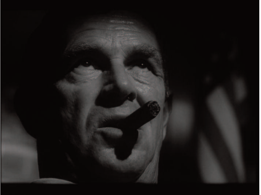
Fig. 22 – Uno sguardo stralunato di Jack D. Ripper (un ironico PPP).