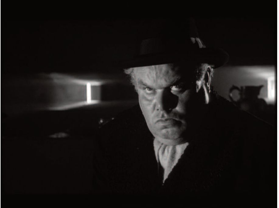
Fig. 37 – Overlooking alla russa.