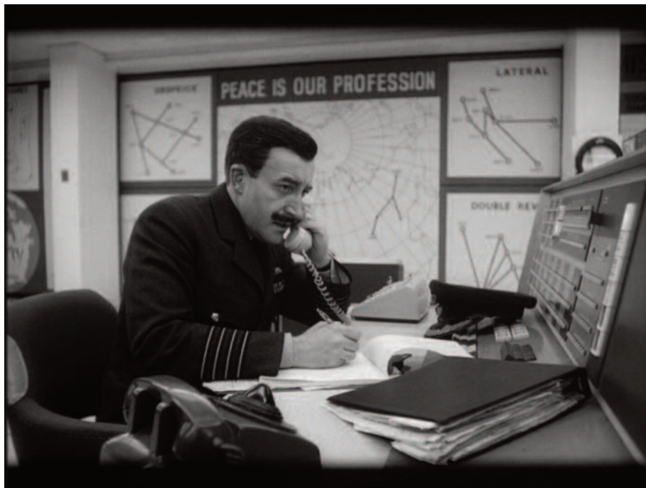
Fig. 4 – Il trasformista Peter Sellers impegnato, come in Lolita , in molteplici ruoli (1).