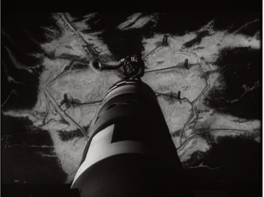
Fig. 27 – Una delle più celebri inquadrature di Kubrick: “King” Kong cavalca la bomba (2).