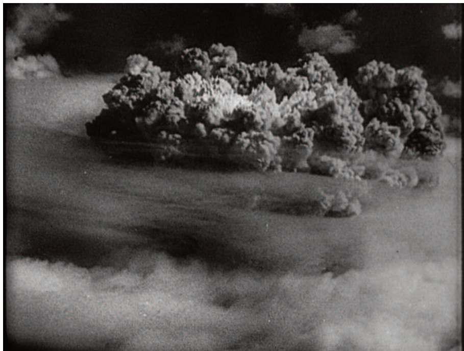
Fig. 38 – La danza della bomba (1).