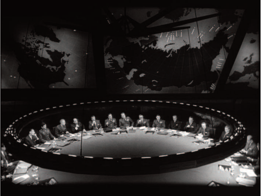
Fig. 13 – Anche in questo film l'ossessione della circolarità.