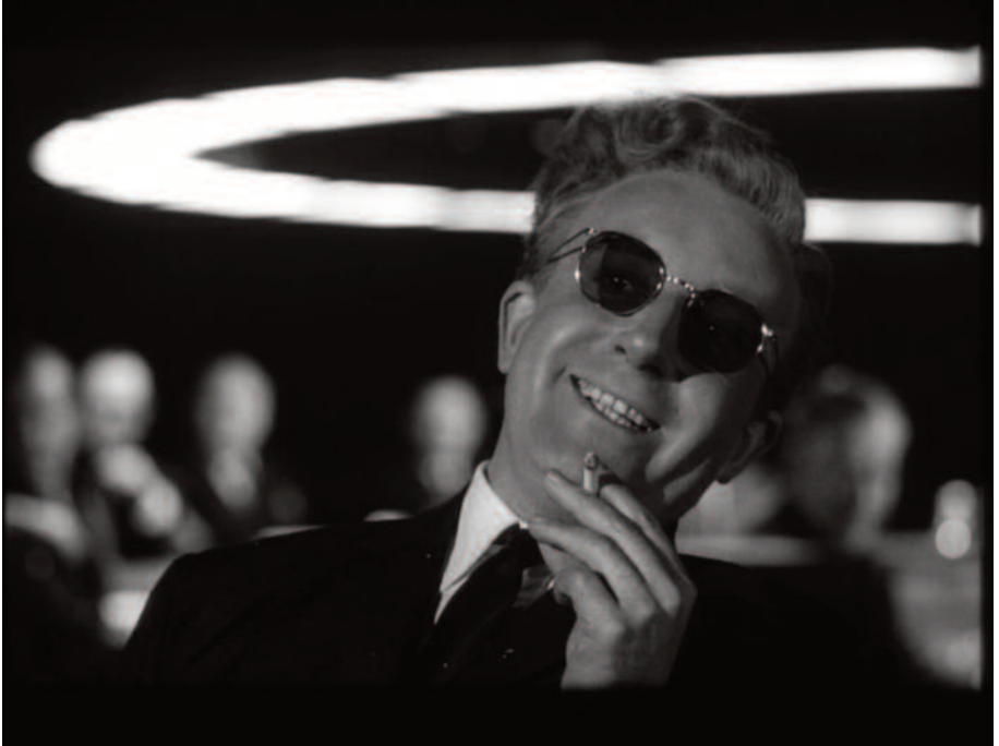
Fig. 19 – La luce circolare come un'aureola.