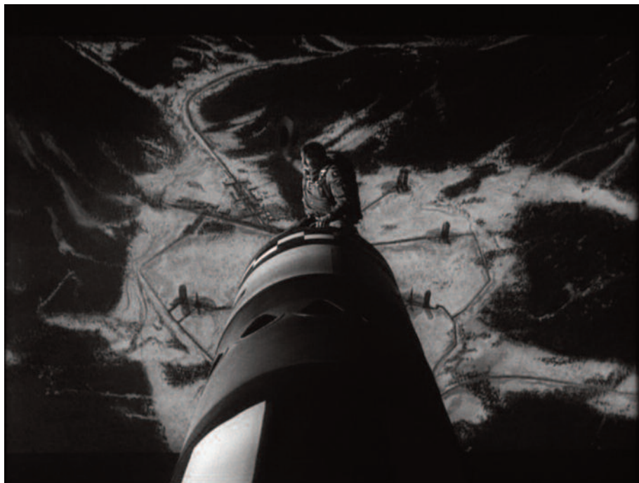
Fig. 26 – Una delle più celebri inquadrature di Kubrick: “King” Kong cavalca la bomba (1).