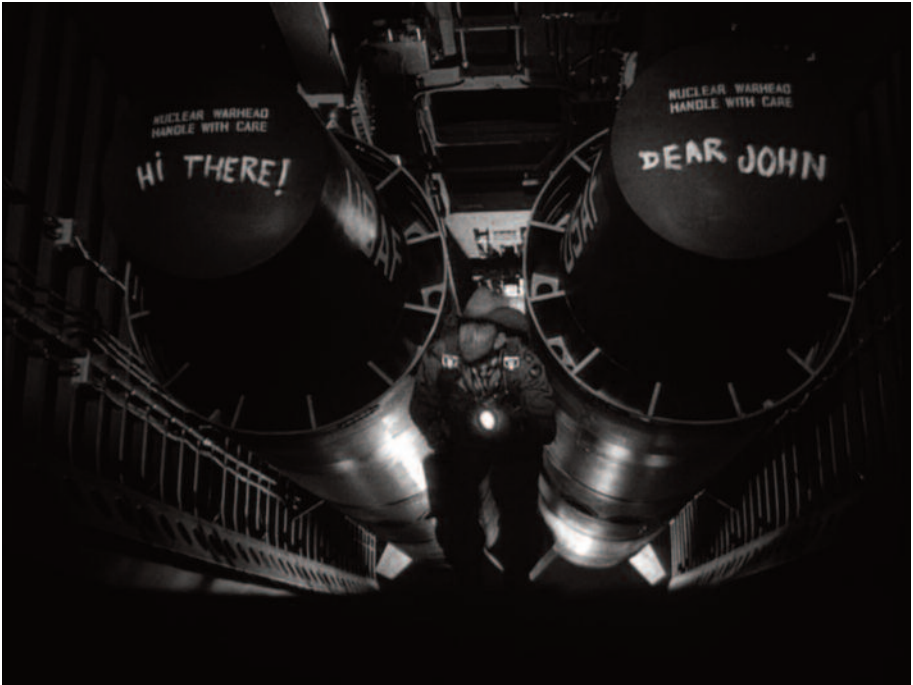
Fig. 25 – La “bomba”, tornata attuale dopo la guerra in Ucraina.