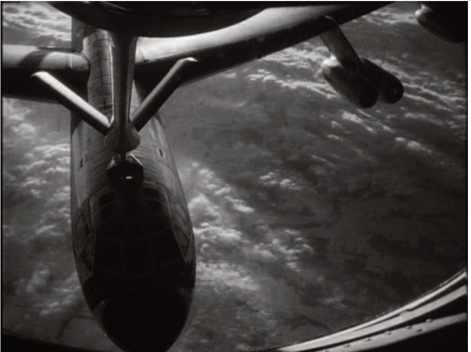
Fig. 1 – Le inquadrature sul bombardiere ricordano vagamente l'astronave di 2001: Odissea nello spazio .