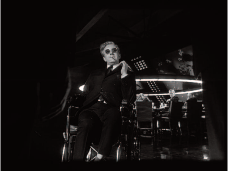
Fig. 18 – Peter Sellers nei panni di Mandrake (e luci circolari).