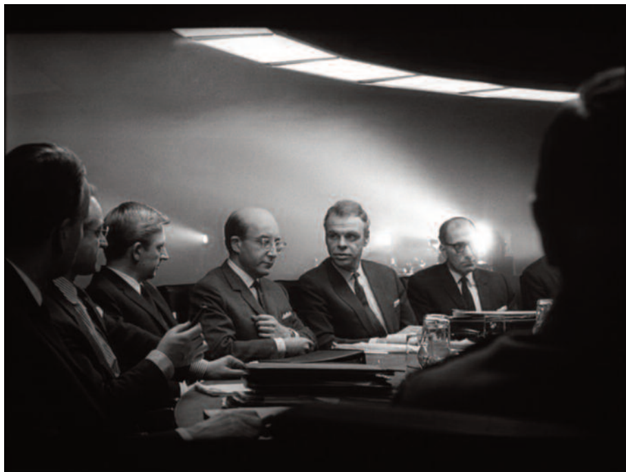
Fig. 12 – Peter Sellers cambia giacca.