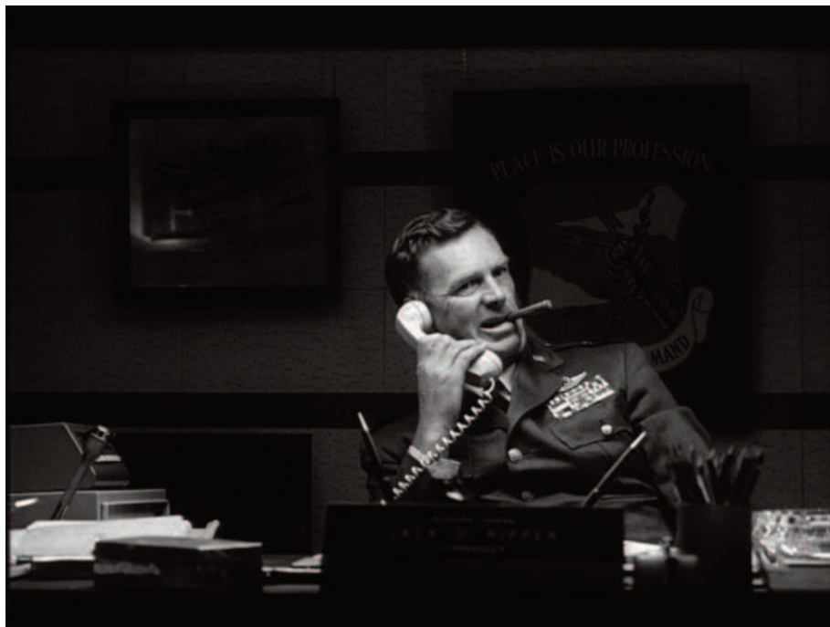
Fig. 2 – I volti ricorrenti di Kubrick: Sterling Hayden (lo abbiamo visto protagonista di Rapina a mano armata ). Coppola lo userà ne Il padrino (è il capitano ucciso da Michael Corleone).