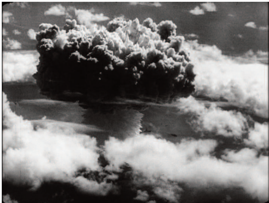
Fig. 40 – La danza della bomba (3).