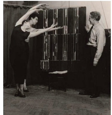
Fig. 5 – Sigurd Leeder nella sua scuola di Londra (1950 circa).

Nell'immagine a sinistra il danzatore è al centro con un tamburo in mano, mentre nell'immagine a destra sta impartendo una lezione di Kinetographie Laban .