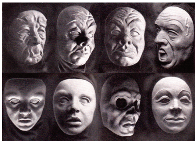
Fig. 3 – Le otto maschere create da Leeder nel 1926 per il duo Totentanz di Jooss.

professionale composta di tre sezioni – teatro, musica e danza – impostate in maniera interdisciplinare, secondo l’idea di Laban di una formazione espressiva globale. Questa scuola nel 1927 è stata trasferita a Essen , dando vita alla Folkwang Schule co-diretta da Leeder assieme a Jooss fino al 1934 (Fig. 4).